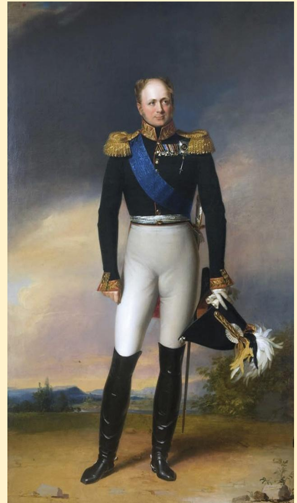
Джордж Доу. Портрет Александра 1

В 1813 году Александр I объявил всему псковскому дворянству благодарность за то, что приняли участие в отражении супостата. О патриотизме местных жителей говорит следующий факт: псковская губерния собрала пожертвование в 14352334 руб., не входя в те 16 губерний, где создавались боевые ополчения. Одного этого достаточно, чтобы показать, как русские люди отреагировали на бурные события 1812 года и какую посильную роль в этом сыграл город Торопец.