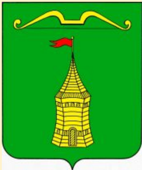
Герб города Торопца: щит и лук-атрибуты войны, сторожевая башня-символ пограничного города

Город Торопец мал, и не на каждой карте его найдёшь, однако он ВЕЛИК ДЛЯ РОССИИ! С древности Торопец был прифронтовым городом. Но постепенно, с расширением размеров государства, он переходил все более и более в тыл. К началу XVIII века город постепенно перешел на положение тыловой базы снабжения русской армии.