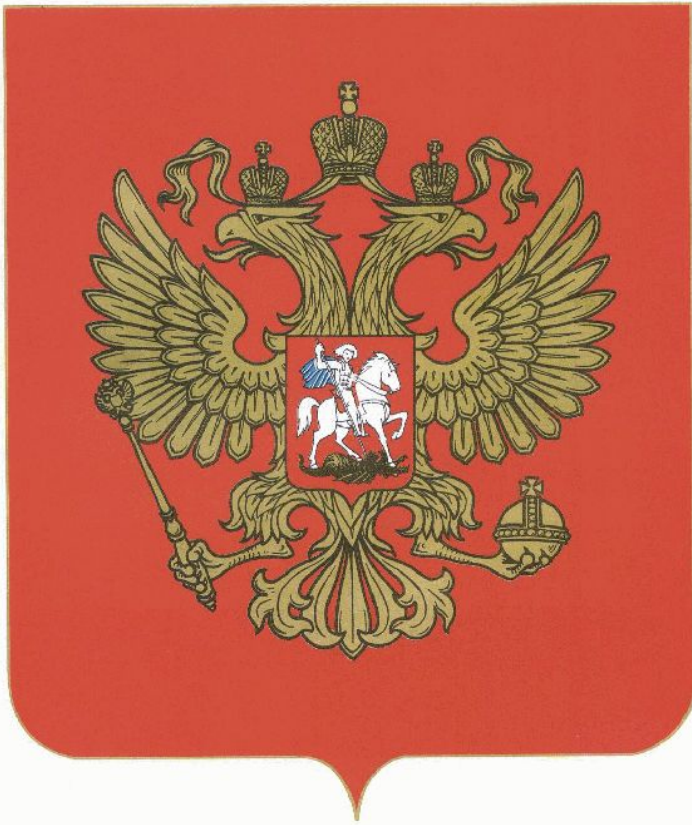
Рисунок Государственного герба Российской Федерации в многоцветном варианте

Приложение 1 к Федеральному конституционному закону «О Государственном гербе Российской Федерации»