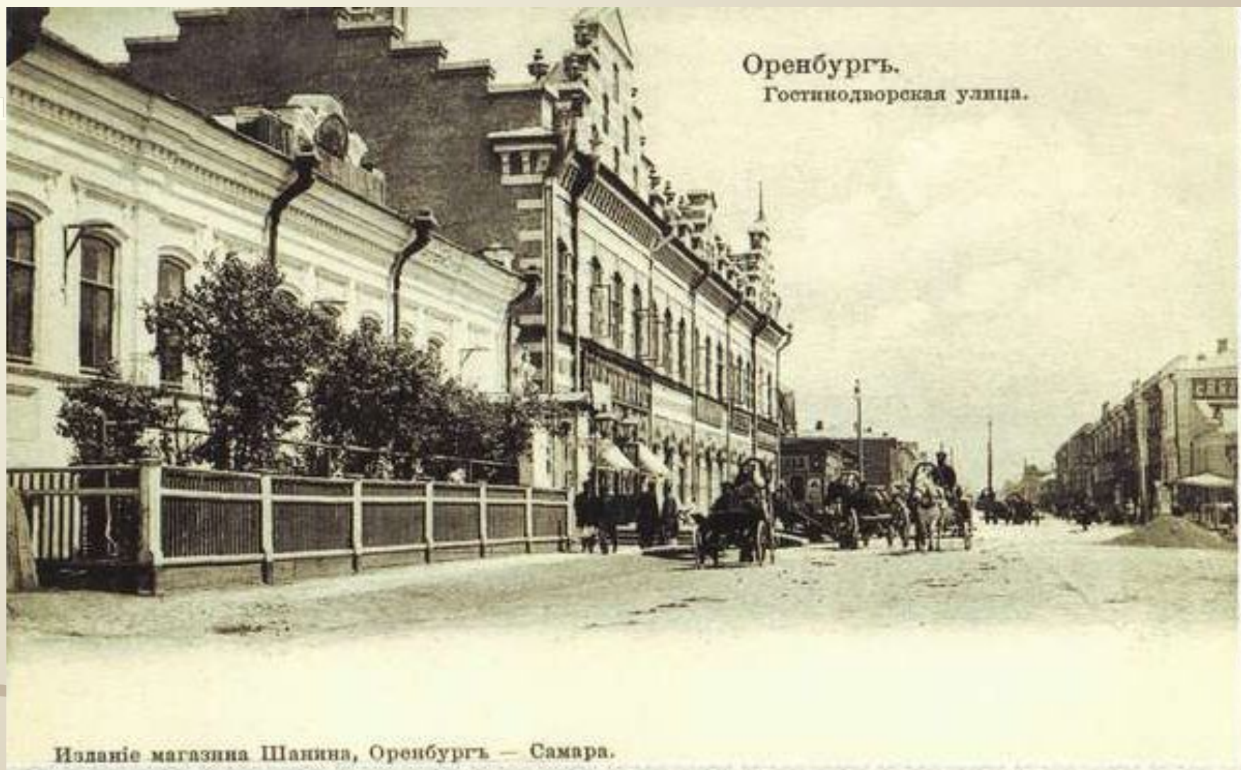
Оренбургъ. Гостинодворская улица.

Издание магазина Шанина, Оренбургъ — Самара.