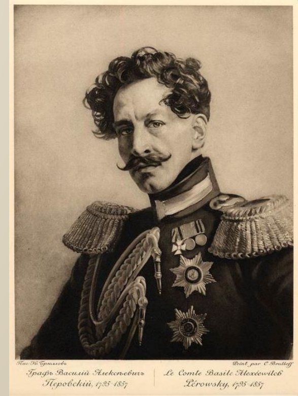
В.А. Перовский- губернатор Оренбурга (1833-1842)

4) Новый план - новую застройку начали от линии современной Орской улицы, оставив площадь между Новой слободкой и Новым планом, которую называли Мариинской. Первая продажа дворовых мест в Новом плане состоялась осенью 1879 года.