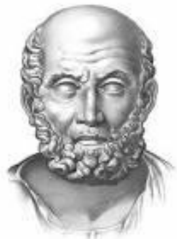
ГИППОКРАТ 460-370 до н. э.

Греческий врач Гиппократ стал основателем классической медицины, живший на рубеже V—IV вв. до н. э. Его образование началось в школе жрецов: он изучал вавилонские и египетские тексты, а для углубления полученных знаний предпринял путешествие в Египет, на Сицилию и в Ливию. Достаточно рано он ушел от жреческо-религиозной традиции к созданию медицинской науки, характеризующейся научным и рациональным подходом к действительности. Гиппократ доказал, что причиной болезней вовсе не являются злые духи, что болезни возникают вследствие плохой работы