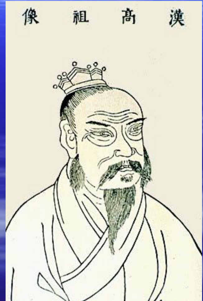
Лю Бан – основатель династии Хань