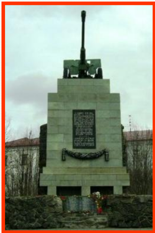
Памятник воинам 6-й Героической комсомольской батареи