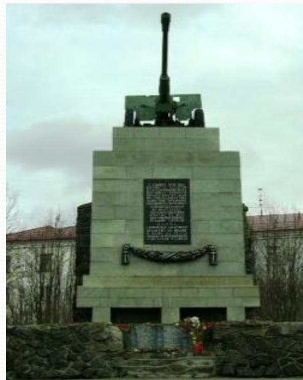
Памятник воинам 6-й Героической комсомольской батареи