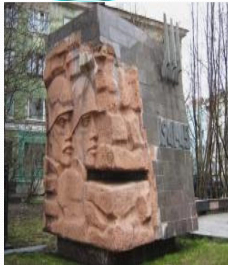
Памятник «Воинам-строителям, защитникам Родины в Великой Отечественной войне 1941-1945»