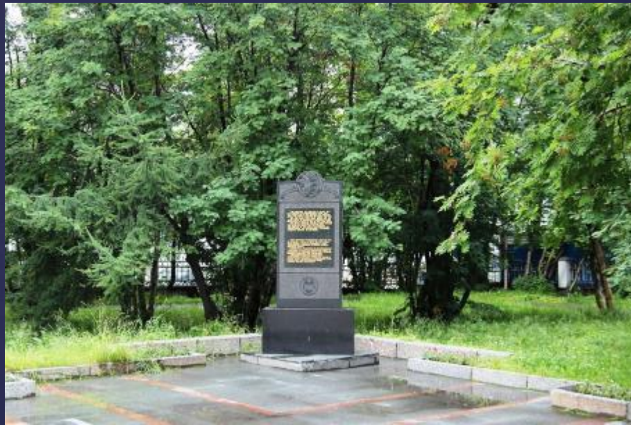
Памятник участникам полярных конвоев. Сквер кинотеатра «Родина»

Гитлеровские подлодки топили все суда, шедшие к Кольскому полуострову. Они нападали на суда конвоя наших союзников. После торпедирования фашистские лодки всплывали и расстреливали шлюпки и оставшихся в живых людей.