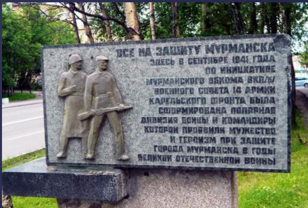
Памятный знак в честь воинов Полярной дивизии. Проспект Ленина

В сентябре 1941 года, когда создалось особо тревожное положение, город срочно сформировал из населения Полярную дивизию, которая нанесла фашистам немалый урон. Врагу удалось пройти всего двадцать пять — тридцать километров от границы.