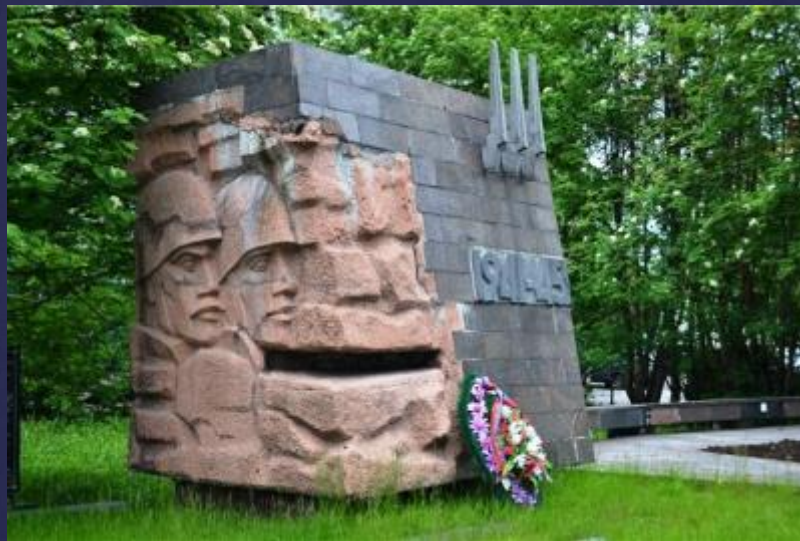
Памятник «В честь строителей, погибших в 1941—1945 годах». Улица Профсоюзов

Местом для памятника стала точка, где, по воспоминаниям ветеранов в 1941 году формировались отряды добровольцев, на которых легла вся ответственность за восстановление города.