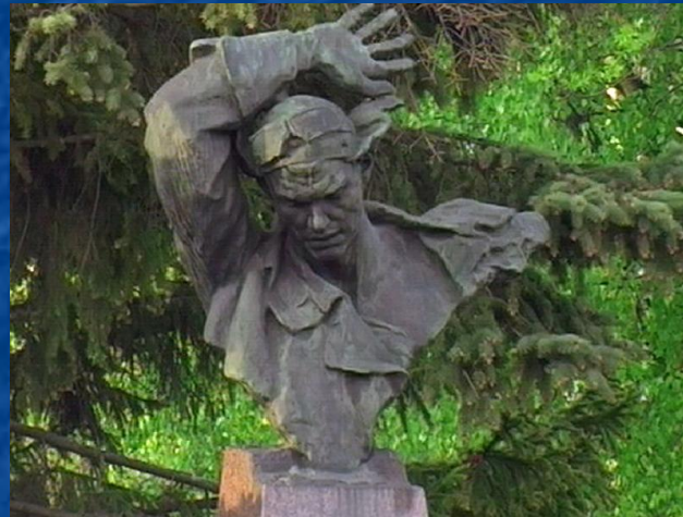
Памятник Н.Ф. Гастелло в городе Муроме