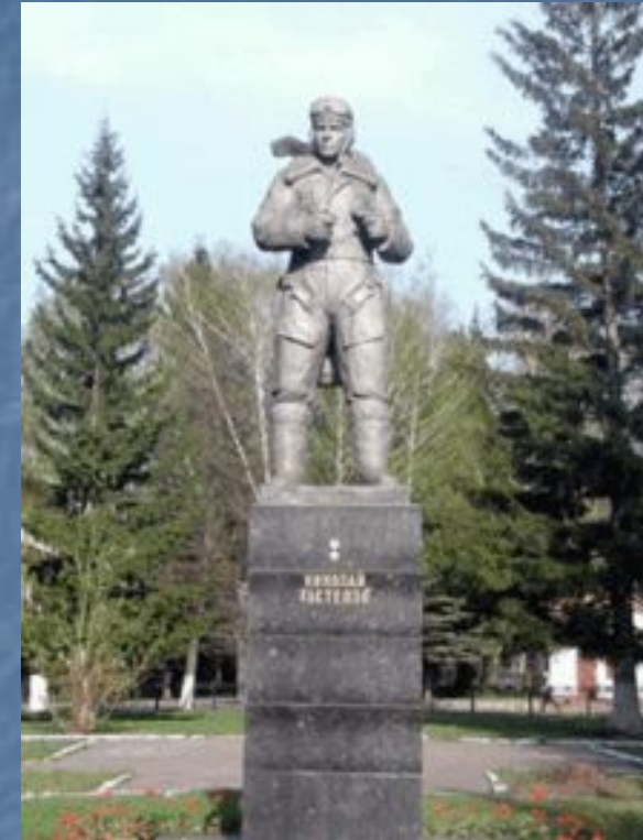
Памятник Н. Ф. Гастелло в сквере около вечернего факультета Уфимского авиационного университета