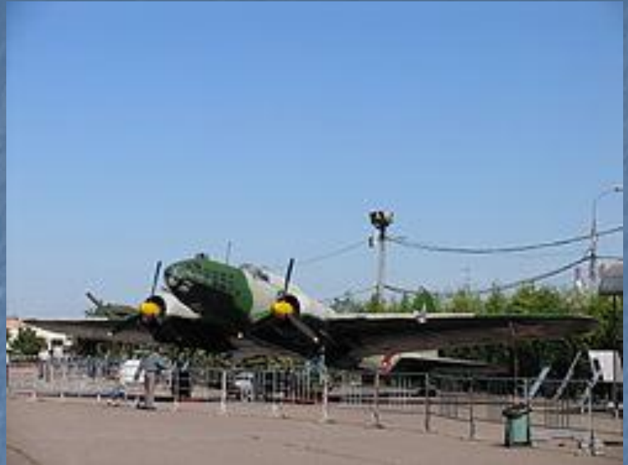
Дальний бомбардировщик ДБ-3ф (Ил-4). На самолёте этого типа совершил свой подвиг экипаж Н. Ф. Гастелло

Весной 1941 года Николай Гастелло, пройдя соответствующую переподготовку, освоил самолет ДБ-3ф