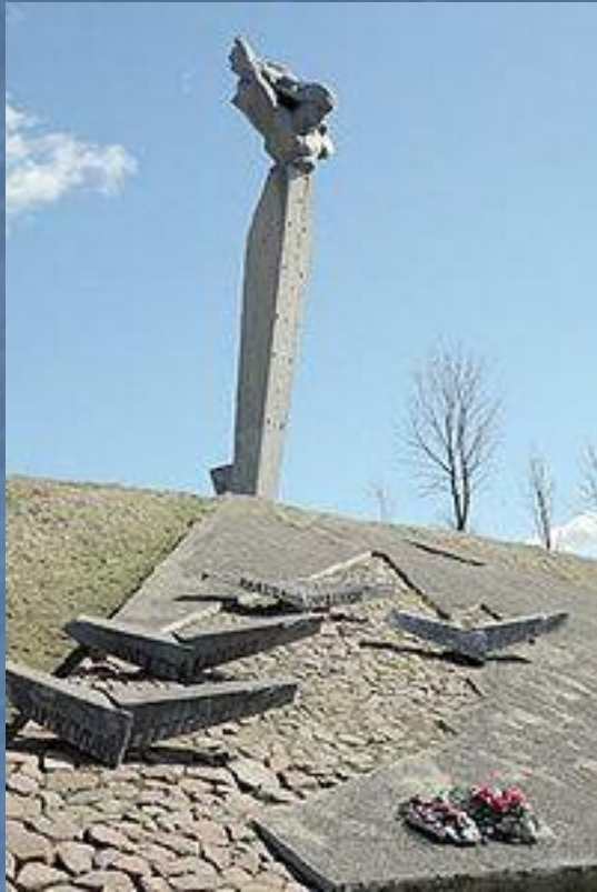
Памятник экипажу Н. Ф. Гастелло на месте гибели бомбардировщика А. С. Маслова