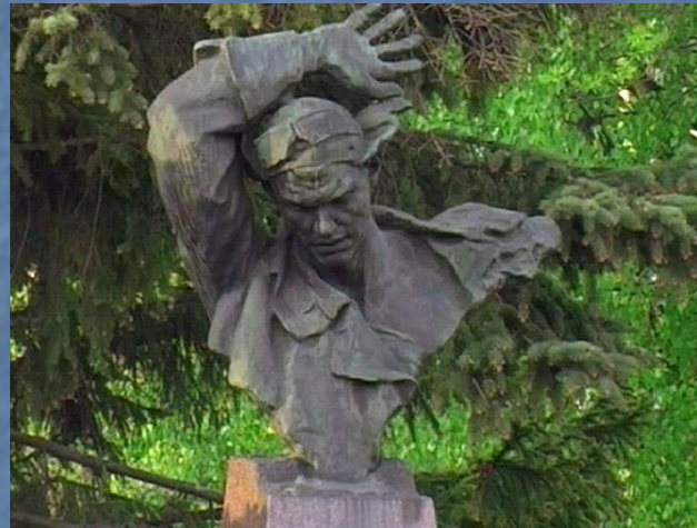
Памятник Н.Ф. Гастелло в городе Муроме