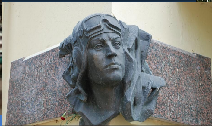
Памятник Герою Советского Союза- Гарееву М.Г., г. Уфа, Республика Башкортостан

Бронзовый бюст, установленный в 1948 году в родной деревне Илякшиде, в 1960 году перенесен в Уфу и установлен на Бульваре Славы. Вариант скульптурного портрета Гареева М. Г., созданного в 1947 году из базальта скульптором Н. В. Томским находится в Третьяковской галерее.