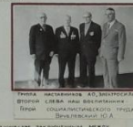
Выпускники Лицея, руководившие работами цеха «Электросила».

В сотрудничестве с коллегами и сотрудниками различных цехов АО «Электросила» и электромонтажных бригад Ленинграда и Свердловска Лицеисты осуществляют профессиональные занятия, участвуют в профессиональных конкурсах и соревнованиях. Многие выпускники Лицея работают на «Электросиле» производственно-ремонтном цехе. Лицеисты делают вклад в развитие АО «Электросила» до 2000 человек в год.