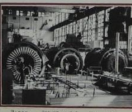
Завод «Электросила» на этом этапе многоэтапного производства.

В сотрудничестве с предприятием и государственными учреждениями Лицея выпускников «Электросила» осуществляют профессиональную подготовку выпускников по профессиям и специальностям Лицея выпускников «Электросила».