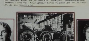
Выпускники цеха «Выпускники» завода «Электросила»

Завод «Электросила» на этом этапе многое удалось произвести.