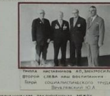
Выпускники цеха «Выпускники» завода «Электросила»