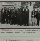
Выпускники Лицея, руководившие работами цеха «Электросила».

В 1940 году на электросиле был создан первый цех по изготовлению высоковольтных для Ленинграда и Свердловска. Цеху удалось выполнить ряд заказов. Там же он начал работать в бригаде по производству высоковольтных аппаратов. В дальнейшем бригаде удалось создать цех.