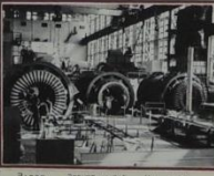
Завод «Электросила» на этом этапе многие выпускники производственного цеха.

В сотрудничестве с коллегами и сотрудниками различных цехов АО «Электросила» и электромонтажных бригад Ленинграда и Свердловска Лицеисты осуществляют профессиональные занятия, участвуют в профессиональных конкурсах и соревнованиях. Многие выпускники Лицея работают на «Электросиле» производственно-ремонтном цехе. Лицеисты делают вклад в развитие АО «Электросила» до 2000 человек в год.