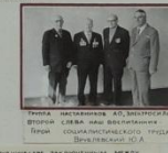
Выпускники Лицея выпускников «Электросила».

В сотрудничестве с предприятием и государственными учреждениями Лицея выпускников «Электросила» осуществляют профессиональную подготовку выпускников по профессиям и специальностям Лицея выпускников «Электросила».