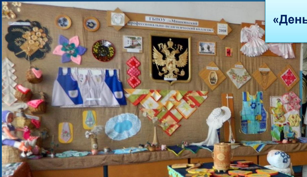
Выставка изделий декоративно- прикладного искусства