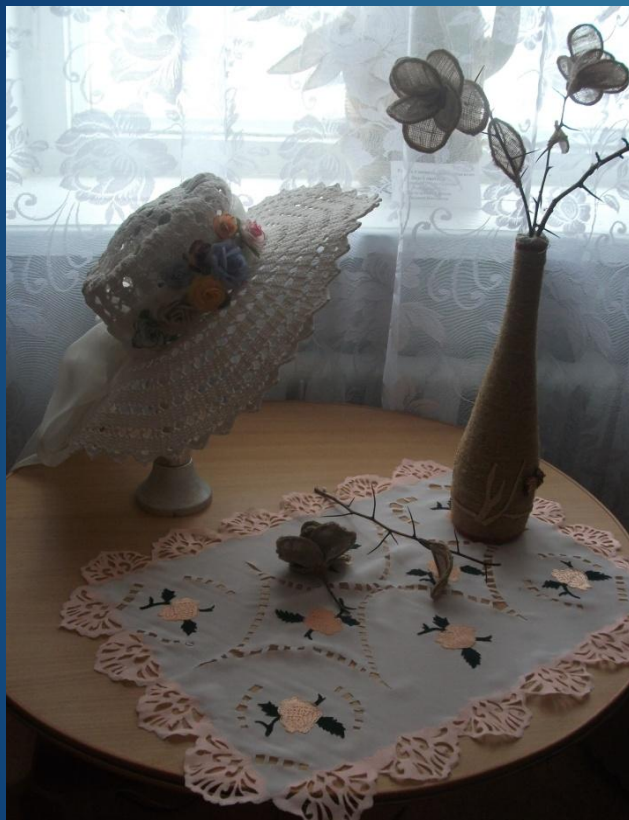
Работа с кожей, соломой, гильоширование