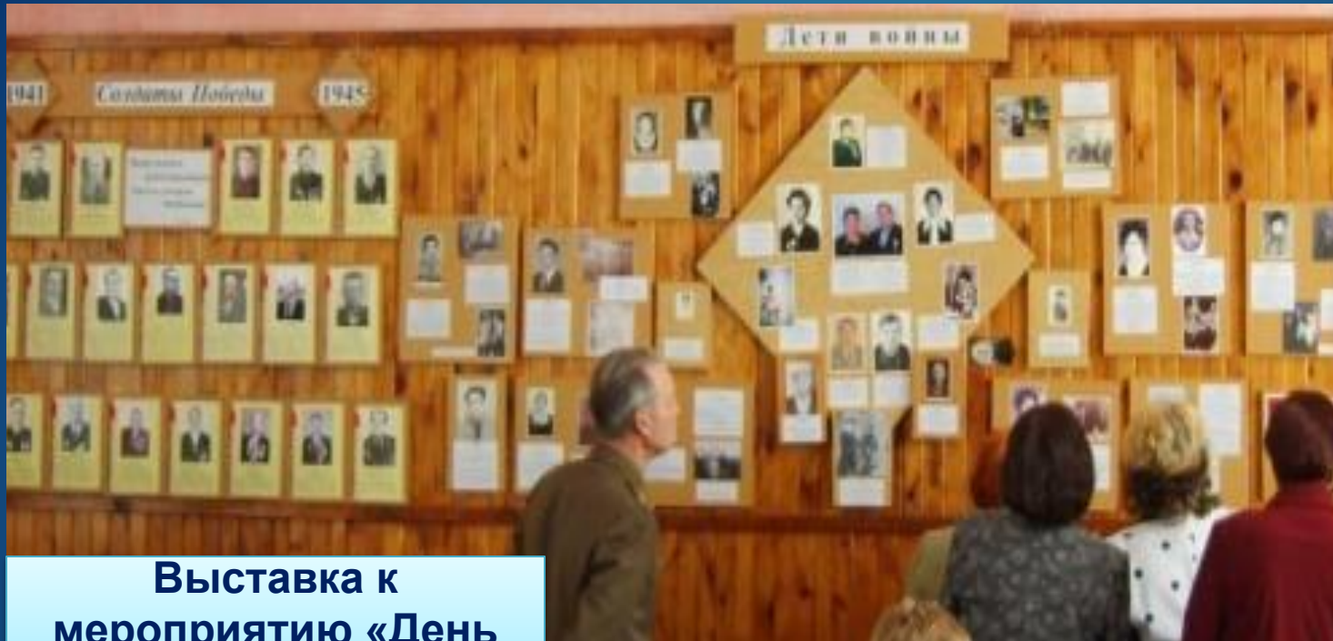
Выставка к мероприятию «День Победы»