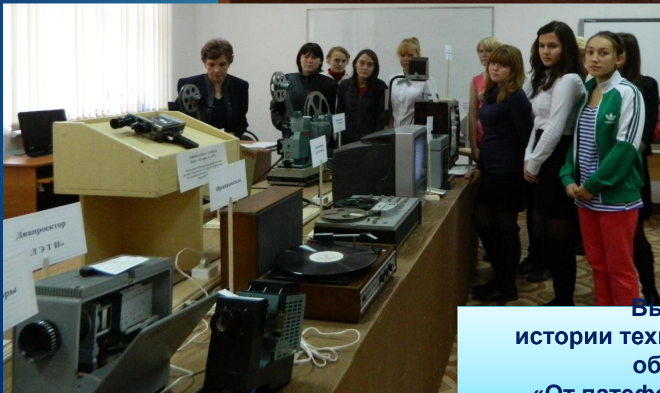
Выставка истории технических средств обучения «От патефона до плазмы»