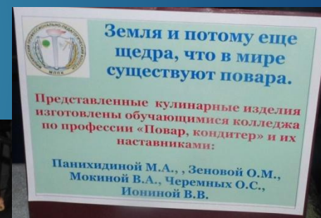
Выставка кулинарных изделий