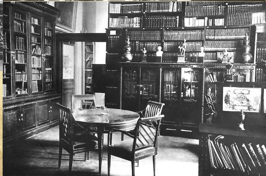
Кабинет и библиотека князя А.И. Вяземского