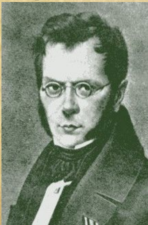
П. А. Вяземский