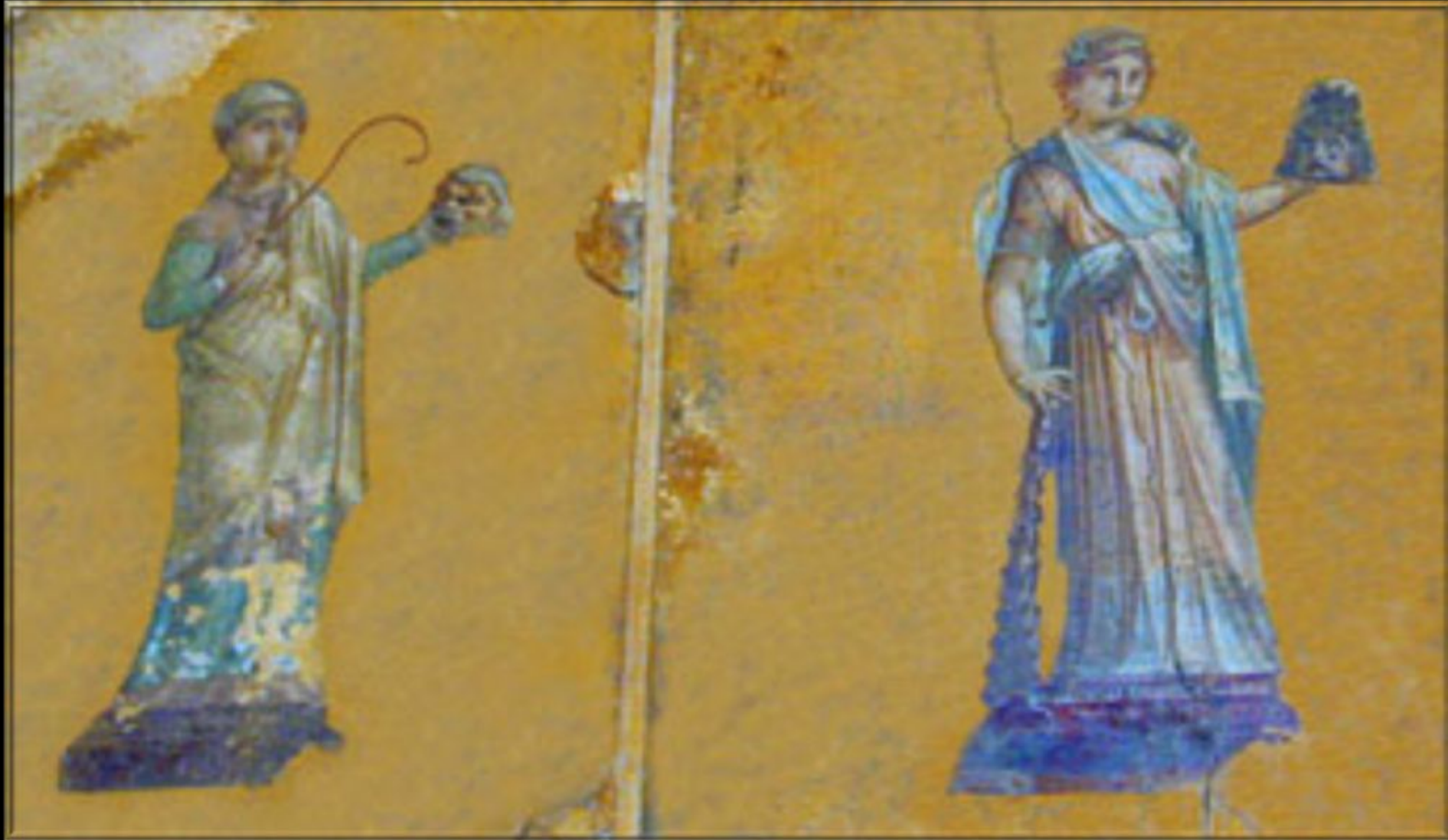
фреска из Помпей, I в. н.э

Муза комедии и муза трагедии. Мельпомена и Талия олицетворяют театр жизни, жизненный опыт.