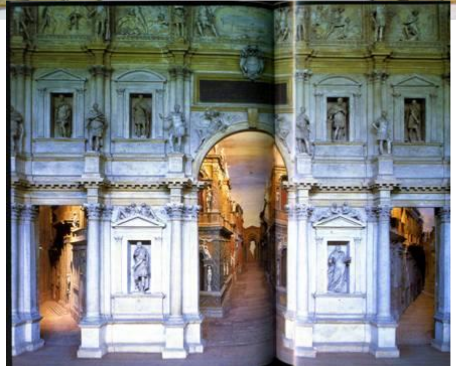
Декорации Театра Фарнезе