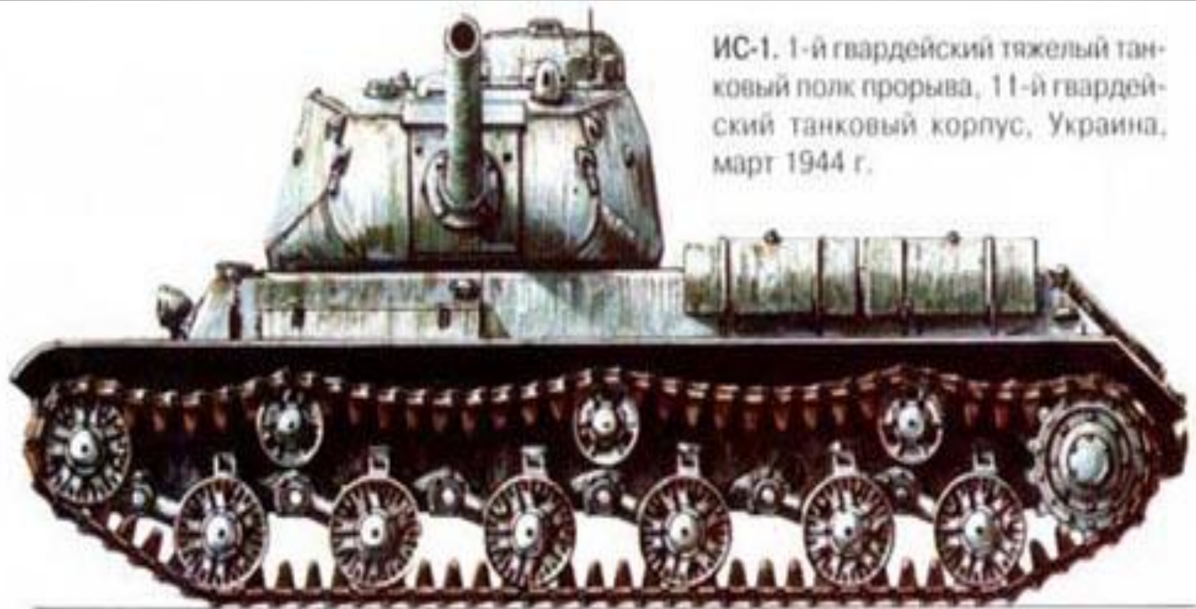
ИС-1. 1-й гвардейский тяжелый танковый полк прорыва, 11-й гвардейский танковый корпус, Украина, март 1944 г.