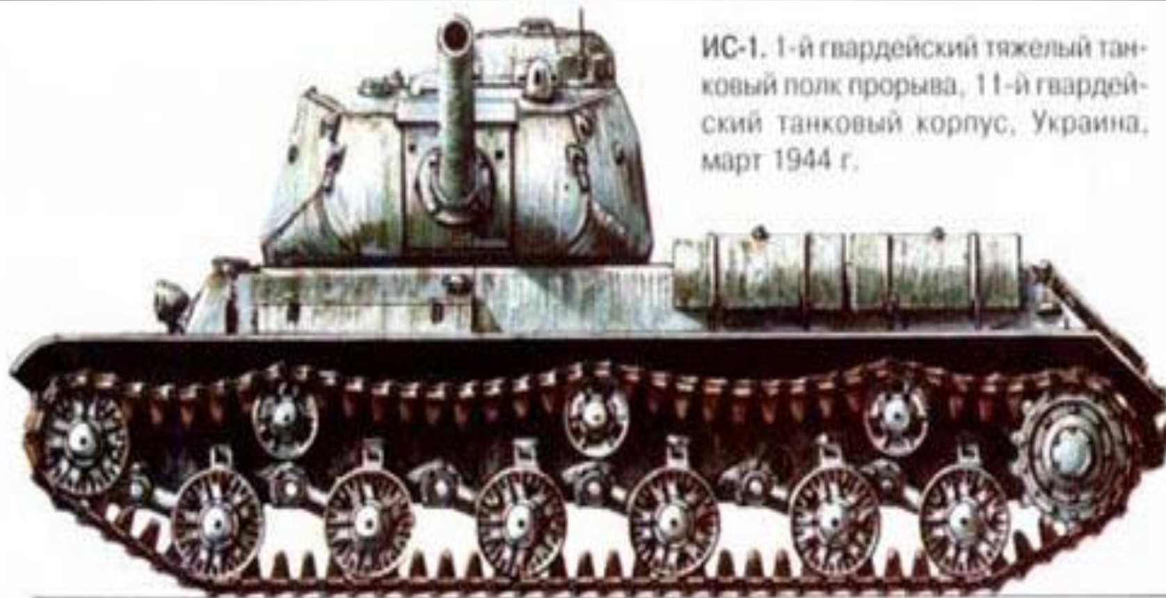
ИС-1. 1-й гвардейский тяжелый танковый полк прорыва, 11-й гвардейский танковый корпус, Украина, март 1944 г.