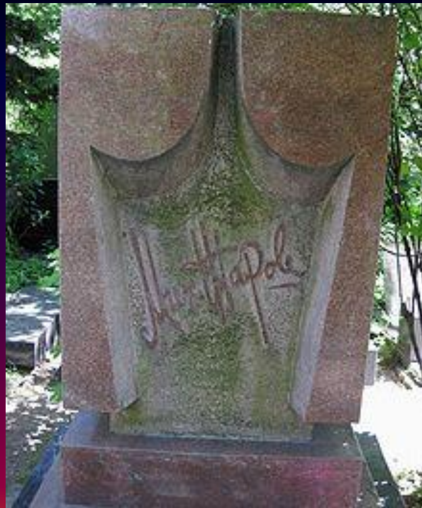
Могила М. И. Жарова на Новодевичьем кладбище