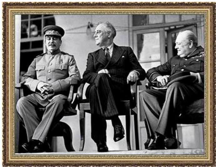
И. Сталин, Ф. Рузвельт, У. Черчилль в Тегеране

Лето - осень 1943 – Освобождены Смоленск, Гомель, Левобережная Украина, Киев.