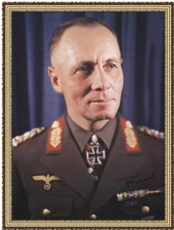
Генерал Э. Роммель

Весна 1941 – Германия в Ливию. Э. Роммель.