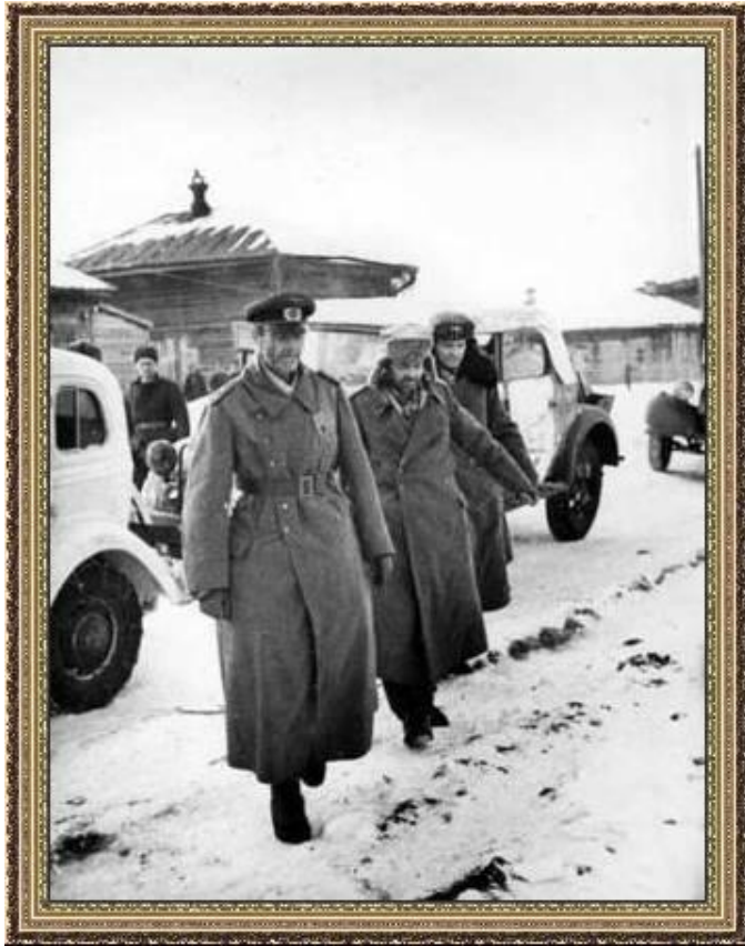
Плененный фельдмаршал Паулюс под Сталинградом

Советско-германский фронт Лето 1942 - Наступление вермахта на Сталинград.