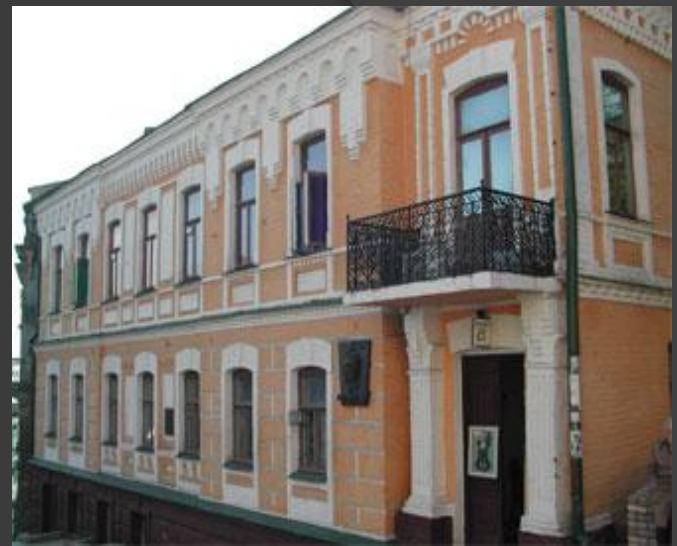
А вот и сам дом-музей М. А. Булгакова. Этот дом занимала с 1906 по 1919 гг. семья Булгаковых. Здесь же жили и Турбины.

После выздоровления Булгаков оставил медицину и начал сотрудничать с газетами. «Грядущие перспективы» – так называется одна из его первых публицистических статей. Первые драматургические опыты появились во Владикавказе: одноактная юмореска «Самооборона», «Парижские коммунары», драма «Братья Турбины» и «Сыновья муллы».