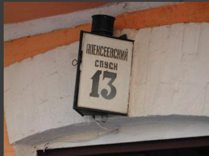
Этот номер - самый важный номер на Андреевском спуске!