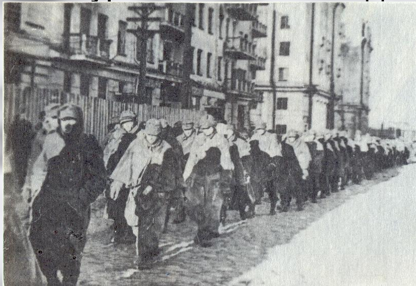
Колонна пленных немцев на улицах Мурманска. 1945 год