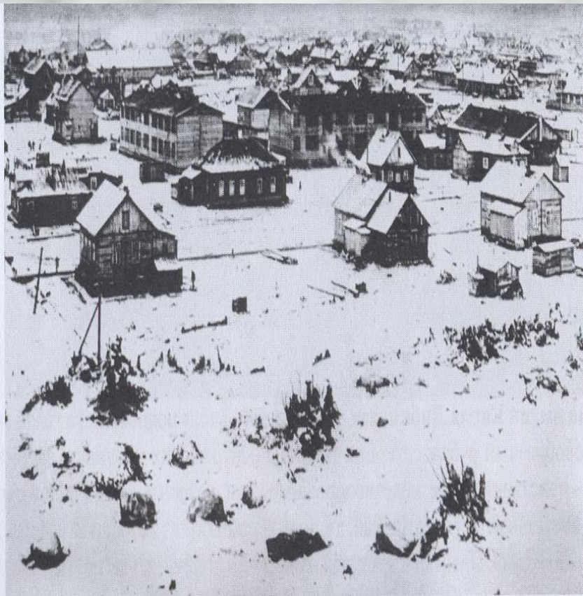
Панорама города со стороны улицы Володарского. 1932 год