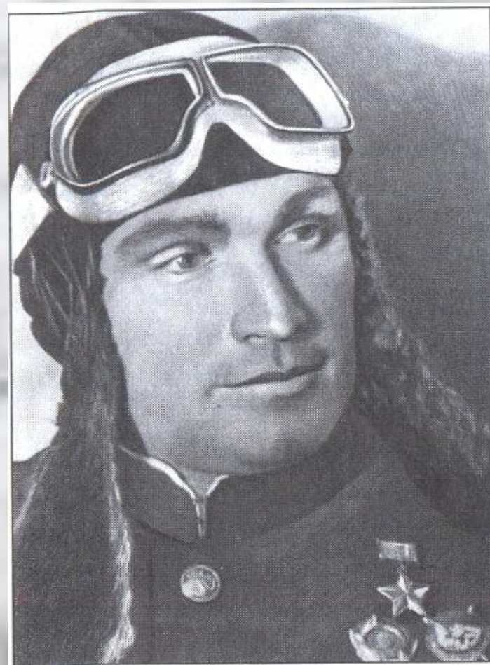
Б. Ф. Сафонов

За героизм и мужество в боях с немецко- фашистскими захватчиками Указом Президиума Верховного Совета СССР от 16 сентября 1941 г. присвоено звание Героя Советского Союза. 14 июня 1942 г. награжден второй медалью «Золотая Звезда». Первый дважды Герой Советского Союза.