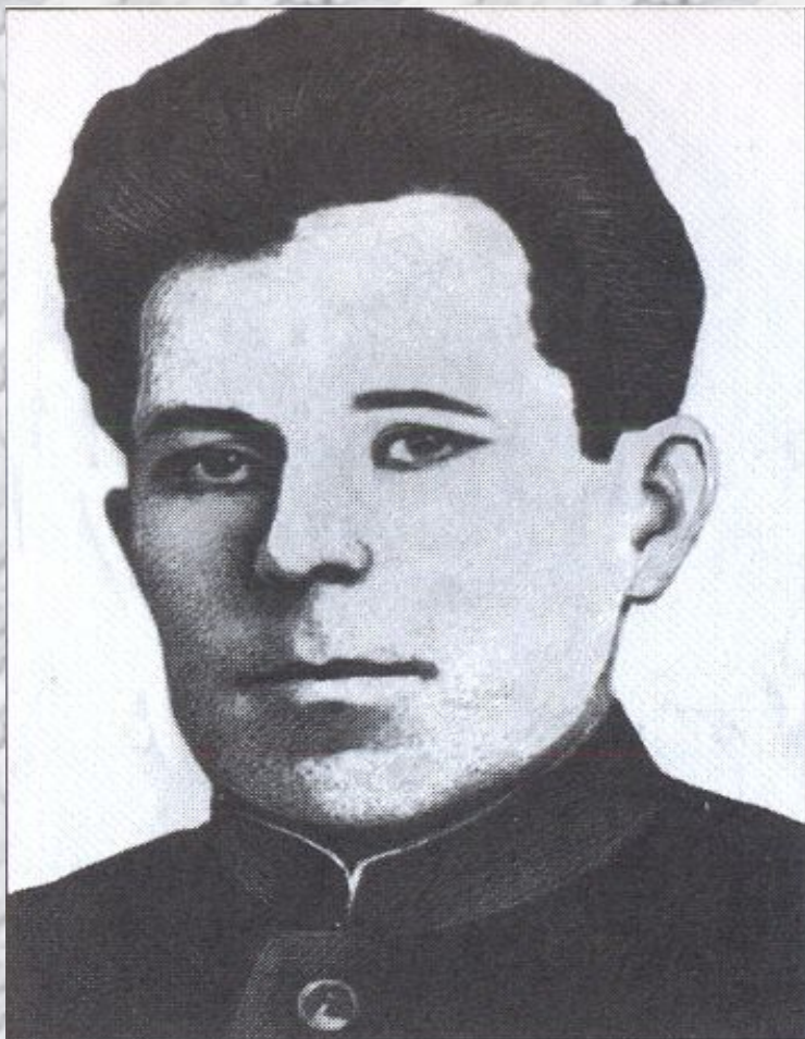
М. И. Гаджиев

Подводник, капитан 2 ранга. С июня 1941 г. по май 1942 г. совершил 12 боевых походов. За героизм, мужество и отвагу в боях с врагом на море Указом Президиума Верховного Совета СССР от 23 октября 1942 г. присвоено звание Героя Советского Союза посмертно.