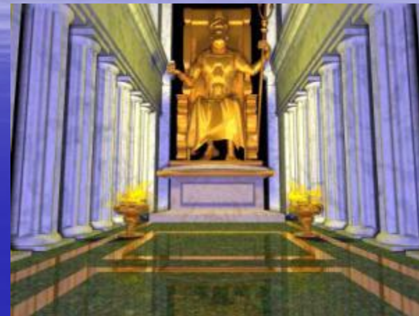
Статуя Зевса в Олимпии