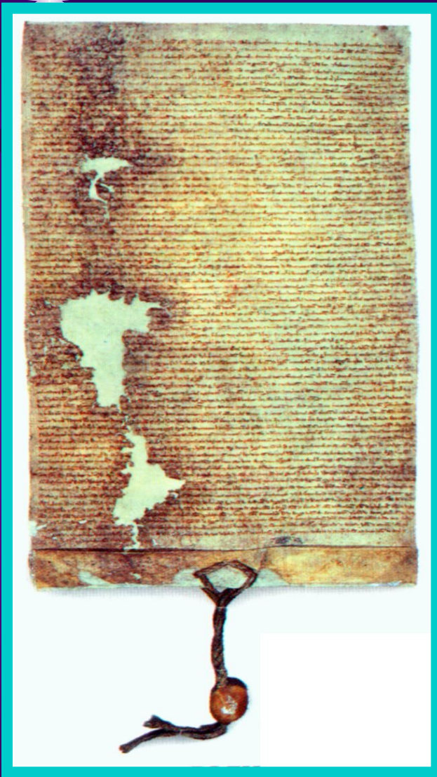
Великая хартия вольностей.