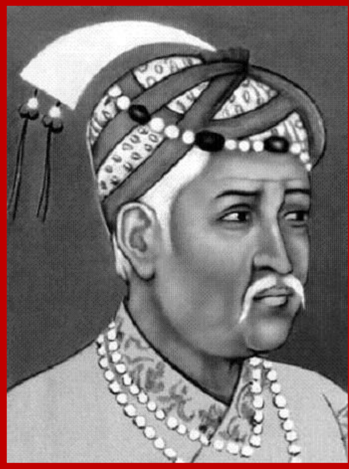
Акбар Великий (1556-1605) Падишах империи Великих Моголов.

Реформы Акбара, проводимые по принципу «мир для всех», укрепили империю Великих Моголов.