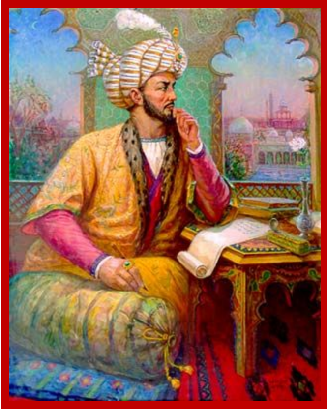
Бабур Великий, падишах Индии