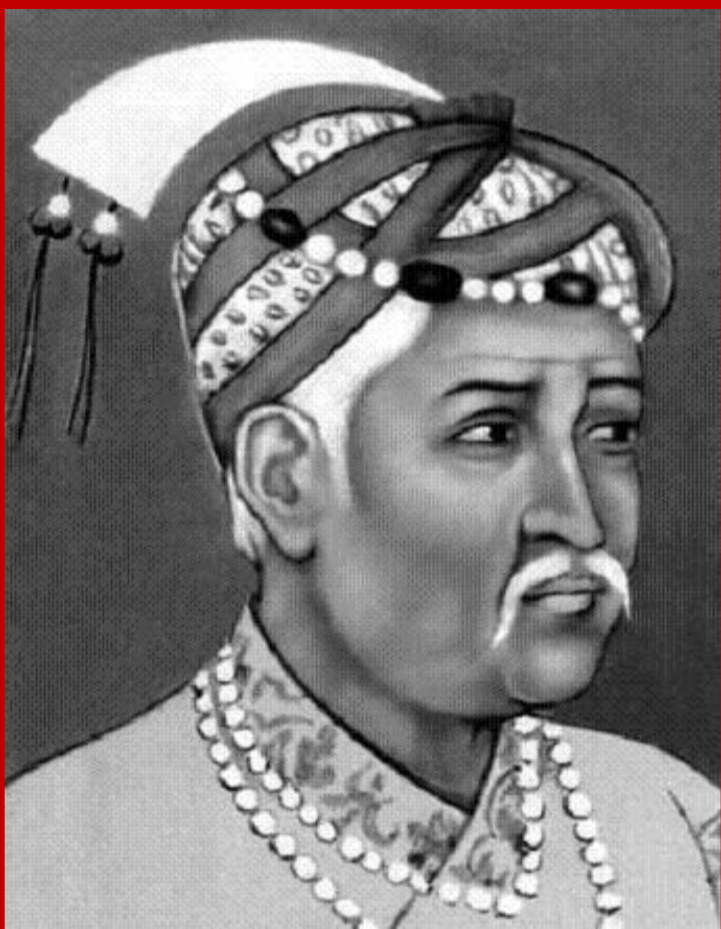
Акбар Великий 1556-1605 Падишах империи Великих

Во много раз увеличил территорию своего государства.