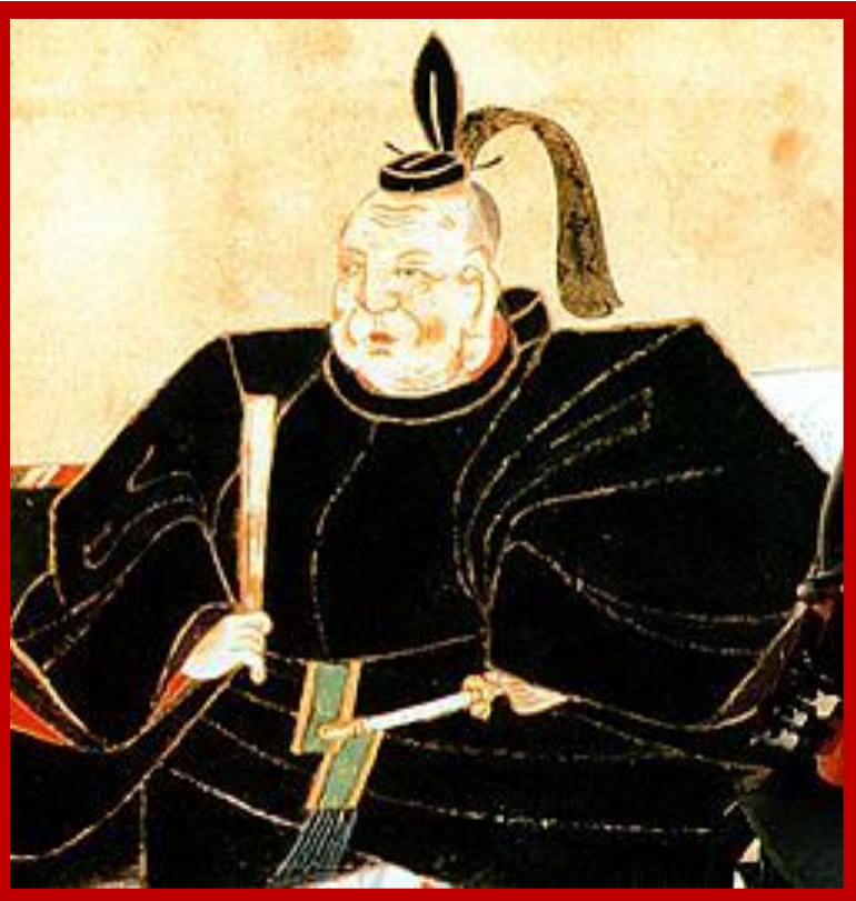
Токугава Иэясу – основатель сёгуната Токугава

В борьбе за власть между феодальными группировками в Японии в конце XVI — в начале XVII в. победу одержал Иэясу Токугава, подчинивший затем своей власти всех удельных князей Японии и принявший титул сёгуна.