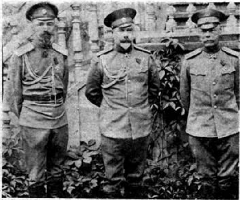
Вожди добровольческой армии: слева — ген С. Л. Марков, в центре — ген. А. И. Деникин, справа — ген. М. В. Алексеев.