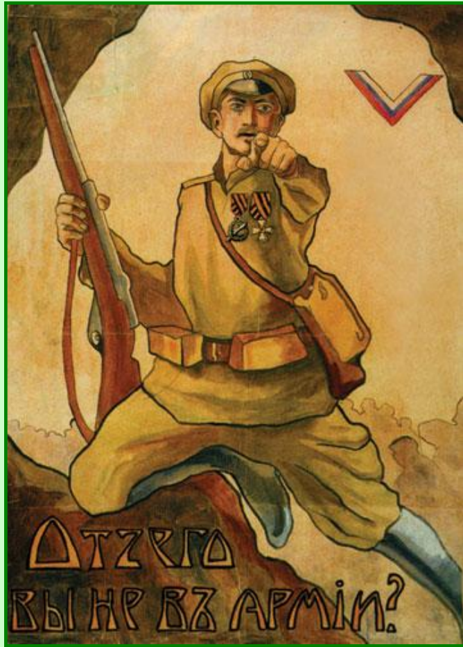
Агитационный плакат Белой армии

Первоначально формирование Белого движения шло на добровольных и безвозмездных началах, позже военнослужащим стали выплачивать жалование. Казаки, довольные Декретом о мире, заняли по отношению к большевикам позицию благожелательного нейтралитета.