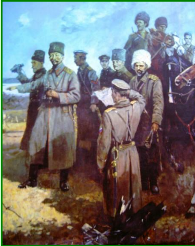
Л.Г.Корнилов под Екатеринодаром

Советское правительство сформировало 10-тысячную армию и в январе 1918 г. она вступила на территорию Дона. Часть населения оказала вооруженную поддержку красным. Атаман Каледин застрелился, Добровольческая армия отступила на Кубань. При штурме Екатеринодара погиб генерал Корнилов. Новым командующим Добровольческой армии стал генерал А.И.Деникин.