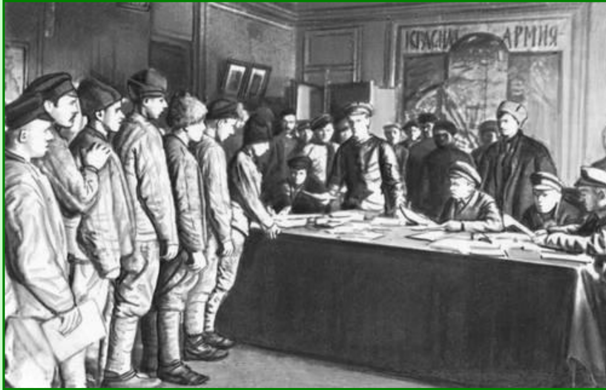
Запись в Красную Армию

Численность Красной Армии быстро росла: осенью 1918 г. – 300 тыс., весной 1919 г. – 1,5 млн., осенью 1919 г. – 3 млн., в 1920 г. – около 5 млн. бойцов. Командные кадры формировались из отличившихся красноармейцев, проходивших краткосрочные курсы подготовки и бывших офицеров царской армии (к 1 января 1919 г. – 165 тыс. чел.)