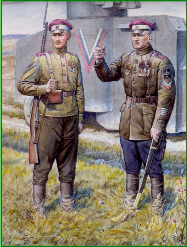
Бойцы Белой и Красной армии