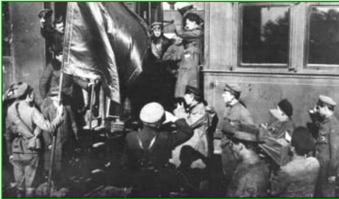
Л.Троцкий среди членов РВС Восточного фронта

15 января 1918 г. – декрет СНК об организации добровольческой Рабоче-крестьянской Красной Армии