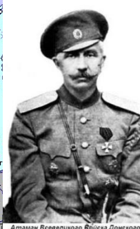
Александр Васильевич Брусилов (май 1918 г. - февраль 1919 г.), генерал от кавалерии Пётр Николаевич Краснов