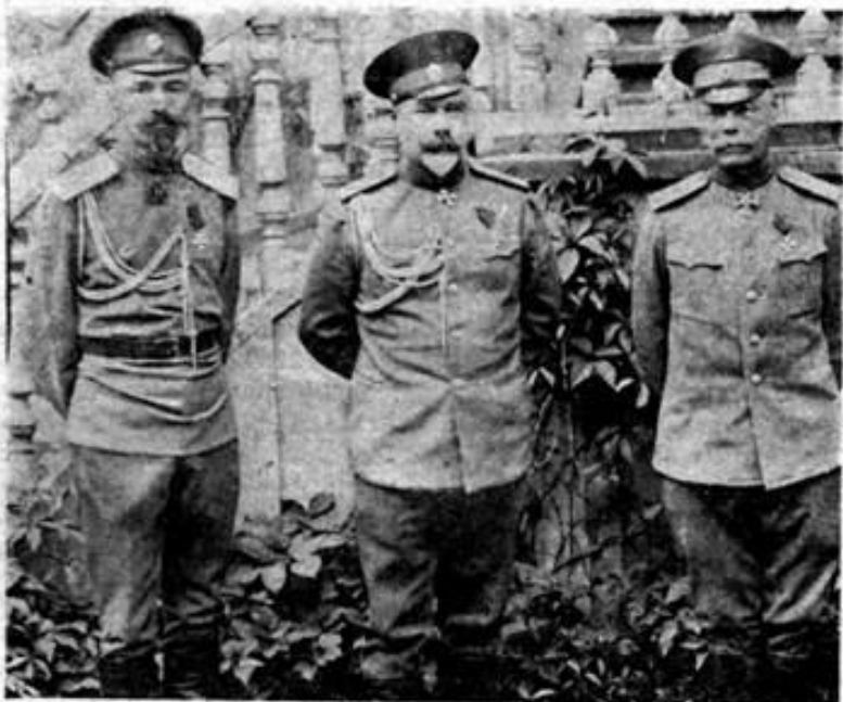
Вожди добровольческой армии: слева — ген С. Л. Марков, в центре — ген. А. И. Деникин, справа — ген. М. В. Алексеев.