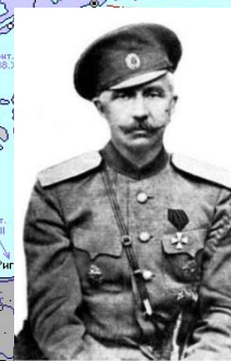
Александр Васильевич Брусилов (май 1918 г. - февраль 1919 г.) генерал от кавалерии Пётр Николаевич Краснов