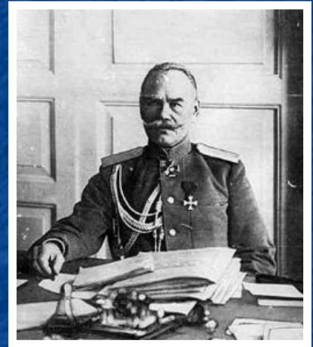
Верховный руководитель Добровольческой армии А.В.Алексеев

Дальний Восток: высадка американских и японских войск.