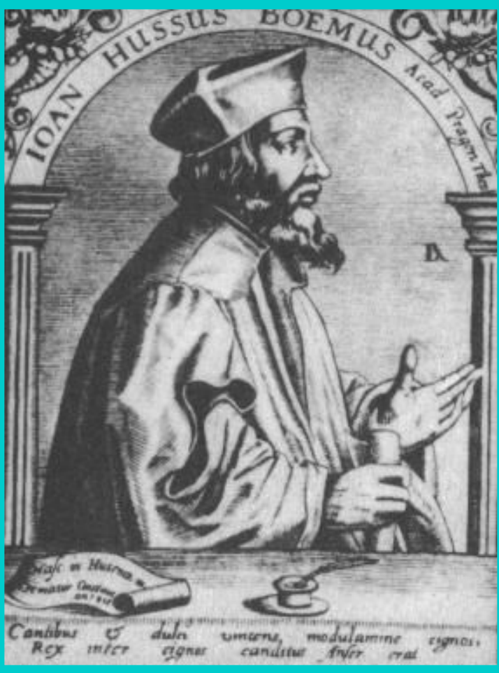
Ян Гус. Гравюра 15 в.

Во главе борьбы с иностранцами встал профессор Пражского университета-Ян Гус-первый чех, выпускник университета.