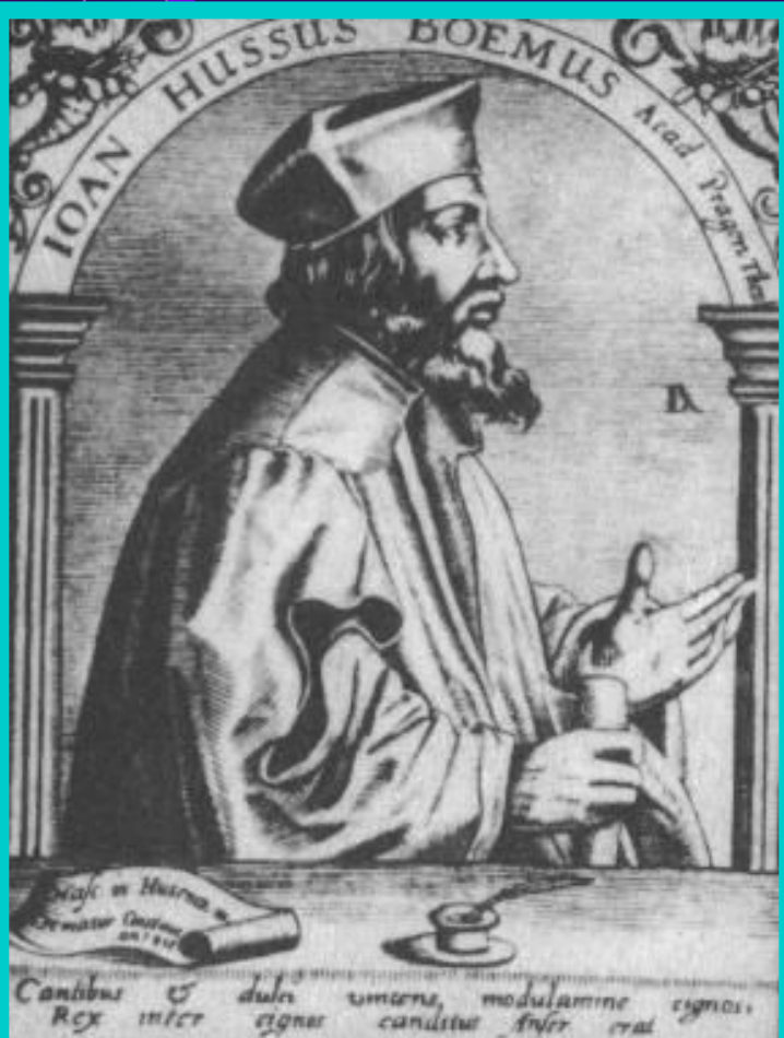
Ян Гус. Гравюра 15 в.

Во главе борьбы с иностранцами встал профессор Пражского университета-Ян Гус-первый чех, выпускник университета.