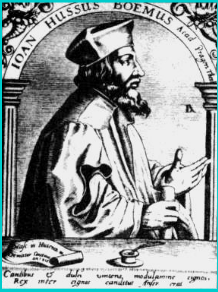
Ян Гус. Гравюра 15 в.

Во главе борьбы с иностранцами встал профессор Пражского университета-Ян Гус-первый чех, выпускник университета.