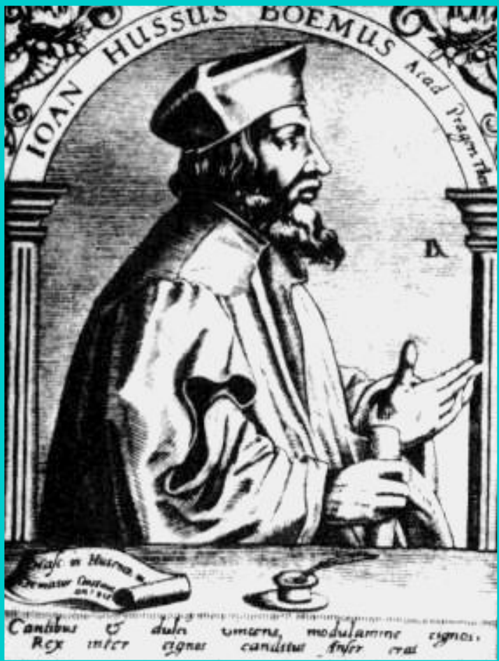
Ян Гус. Гравюра 15 в.

Во главе борьбы с иностранцами встал профессор Пражского университета-Ян Гус-первый чех, выпускник университета.