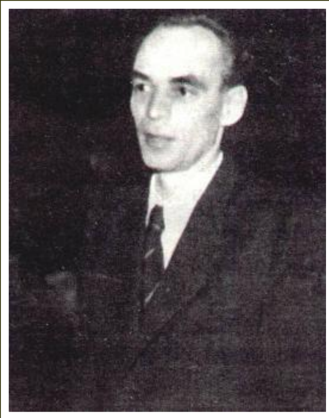
Л.Райк,руководитель компартии Венгрии на судебном процессе.

Коминформ бюро поддержало Сталина, но В. Гомулка (Польша) вступился за Тито. В ответ Сталин развернул репрессии против «титоистов» и «американских шпионов».