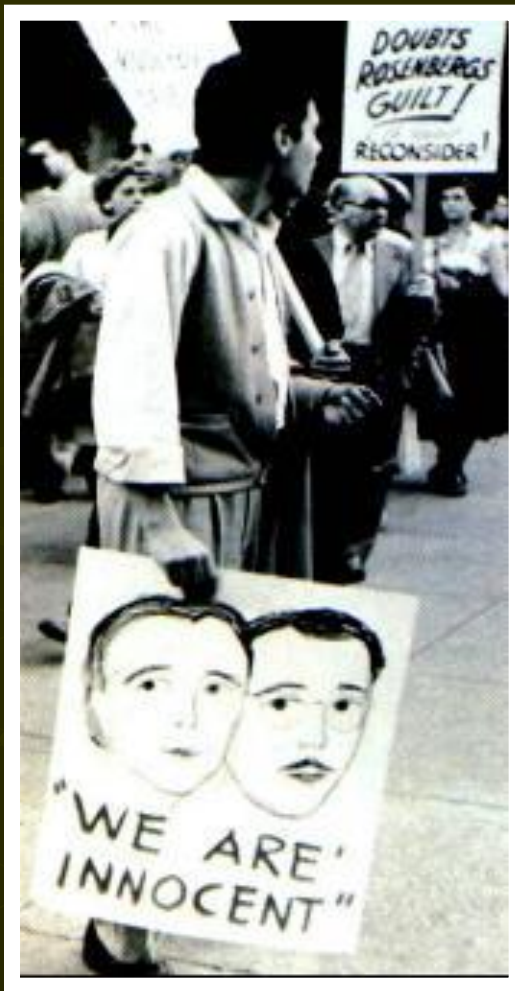
Митинг в защиту Розенбергов.

В США началась «охота на ведьм». В первую очередь удар пришелся по евреям.