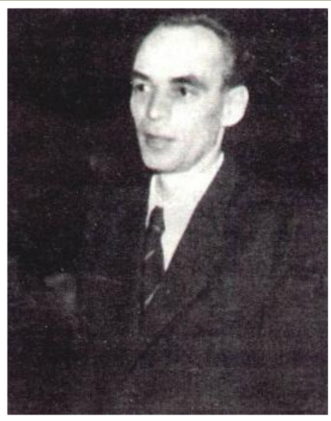
Л.Райк,руководитель компартии Венгрии на судебном процессе.

Коминформ бюро поддержало Сталина, но В. Гомулка (Польша) вступился за Тито. В ответ Сталин развернул репрессии против «титоистов» и «американских шпионов».