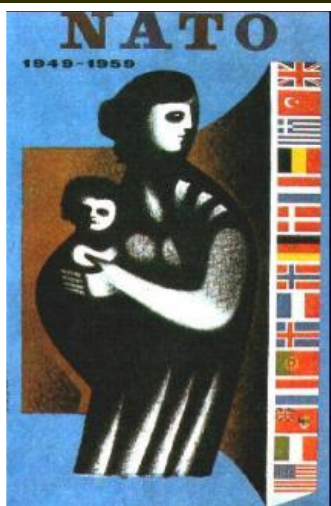
Плакат к 10-летию НАТО.

Между союзниками по антигитлеровской коалиции существовали глубокие различия связанные с различными социальными системами.