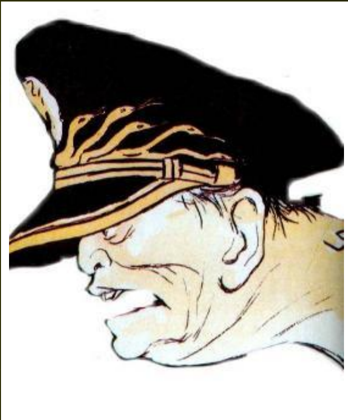
Советская карикатура на И.Броз Тито.

В 1947 г. вместо Коминтерна возникло Коминформбюро, координировавшее деятельность компартий. Но в Югославии коммунисты претендовали на самостоятельность. Тито и Г.Димитров без одобрения Сталина договорились о создании федерации балканских народов. Димитров вскоре умер и гнев Сталина обрушился на Тито. В ответ Тито арестовал всех сторонников СССР в своей компартии. Сталин объявил его фашистом.