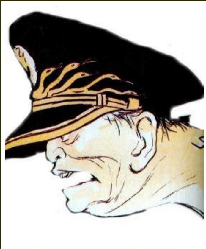
Советская карикатура на И.Броз Тито.

В 1947 г. вместо Коминтерна возникло Коминформбюро, координировавшее деятельность компартий. Но в Югославии коммунисты претендовали на самостоятельность. Тито и Г.Димитров без одобрения Сталина договорились о создании федерации балканских народов. Димитров вскоре умер и гнев Сталина обрушился на Тито. В ответ Тито арестовал всех сторонников СССР в своей компартии. Сталин объявил его фашистом.