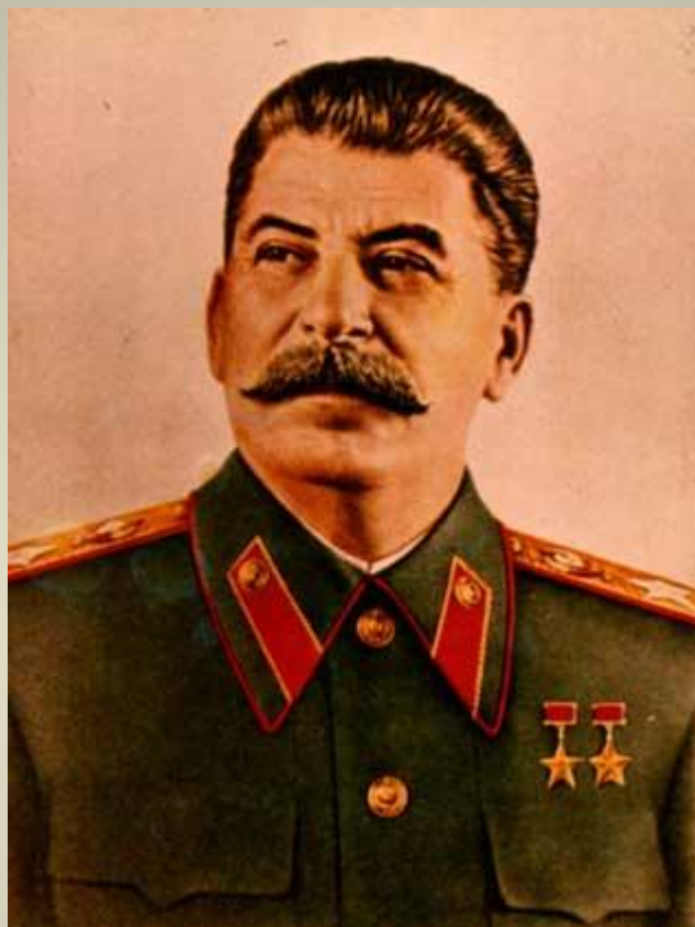
Иосиф Виссарионович Сталин