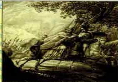
Князь Изяслав в войне против князя Ярослава 1158 г.