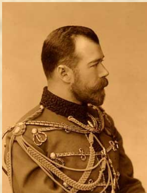
Император Николай II