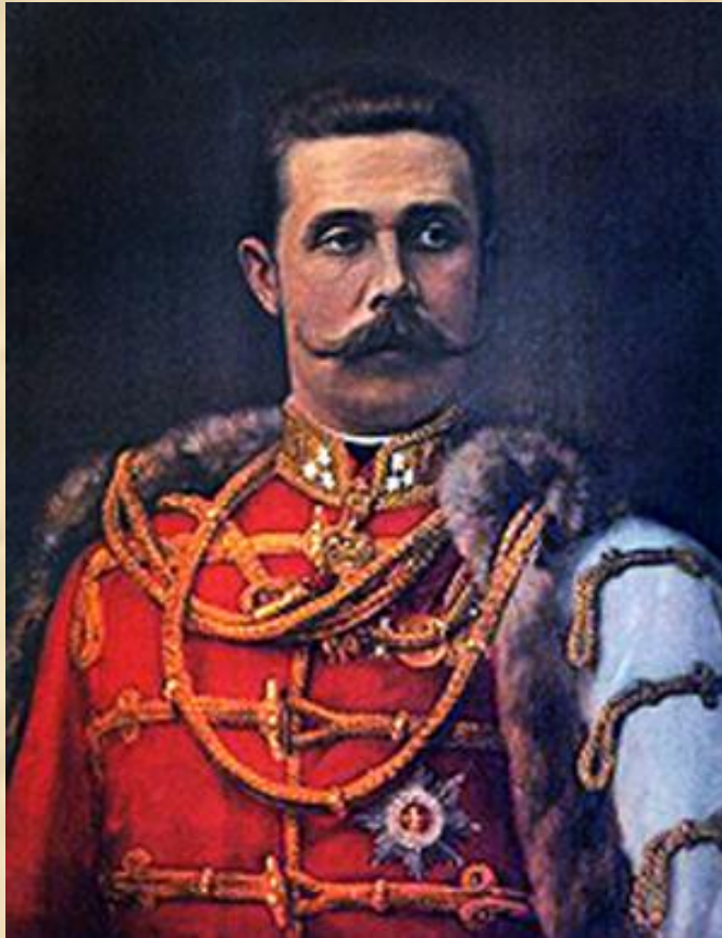
Эрцгерцог Франц Фердинанд