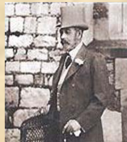
Король Георг V

Морская блокада - перекрытие морских путей для всех судов к побережью враждебного государства.