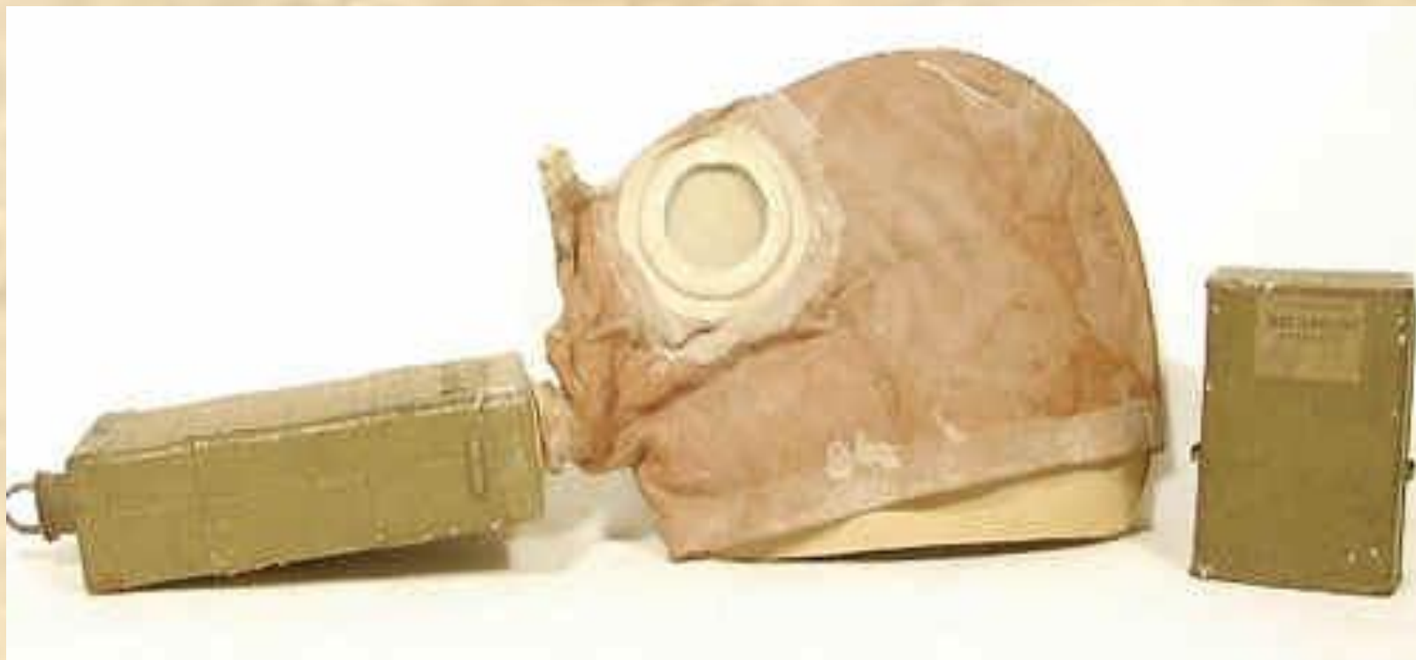
Угольный противогаз Зелинского