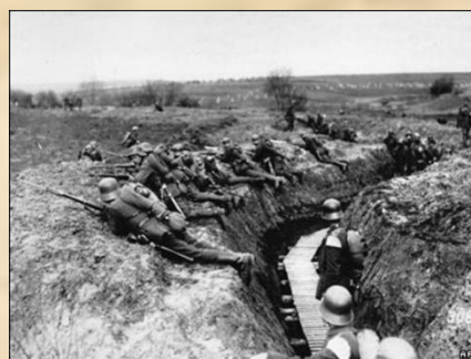
Немецкие войска на позициях