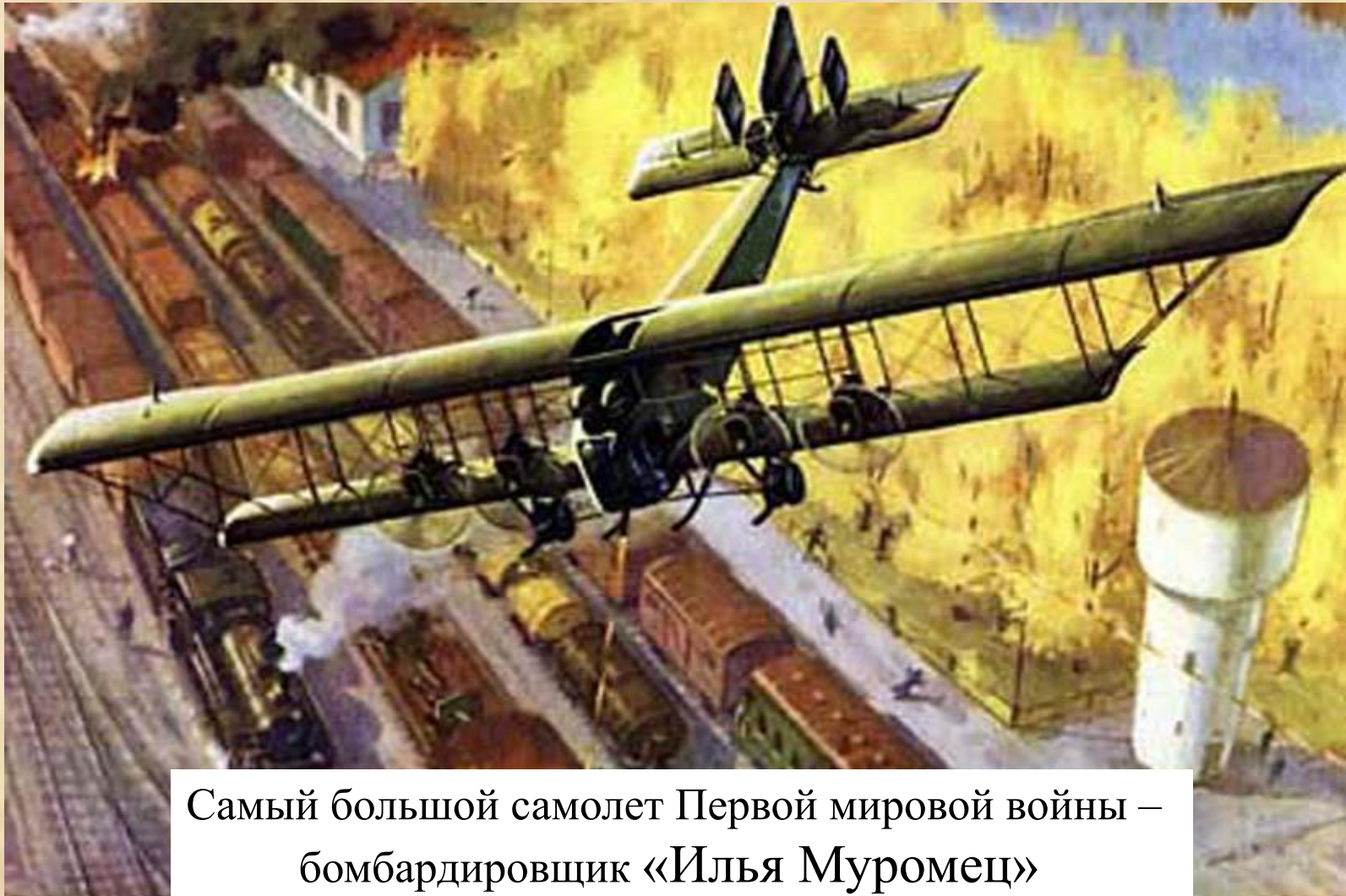
Самый большой самолет Первой мировой войны – бомбардировщик «Илья Муромец»