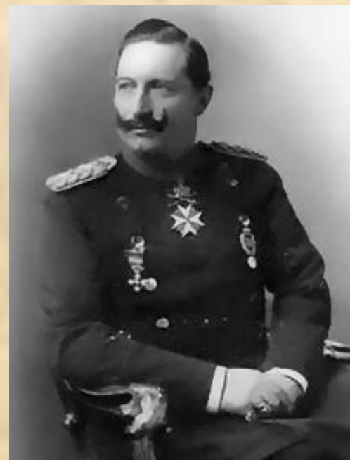
Император Вильгельм II