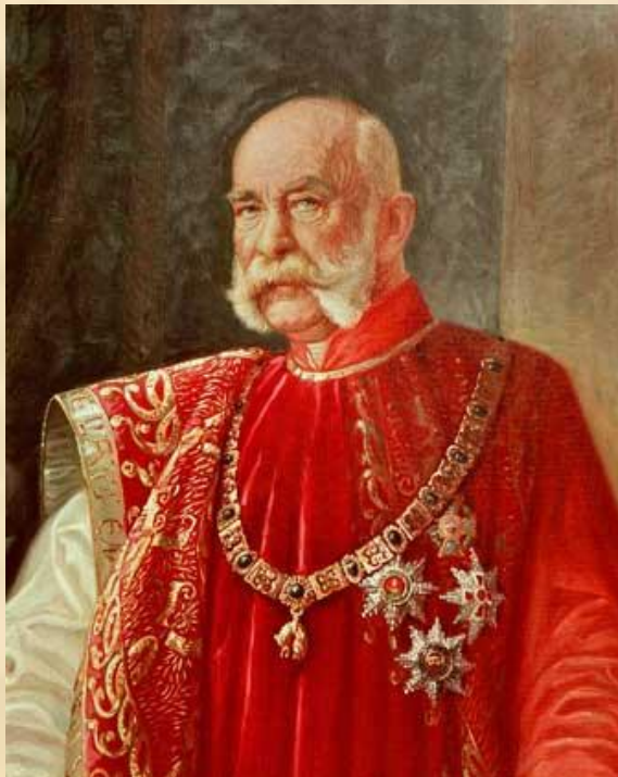
Император Франц Иосиф

23 июля 1914 года Австро-Венгрия предъявила ультиматум Сербии.