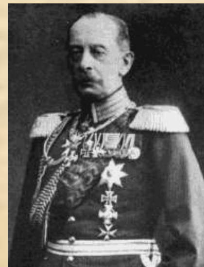
Альфред фон Шлиффен (1833-1913) Начальник германского Генерального штаба

над Францией, до начала активных действий со стороны России.