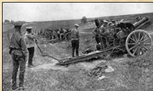
Русские артиллеристы в Галиции