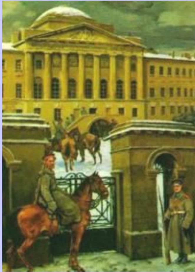
П.Шестопалов. Казачи у Московского университета

В революционное движение втягивалась и интеллигенция. В июне возникли Союзы адвокатов, врачей чиновников и т.д. В июле они объединились в Союз союзов который поставил вопрос о создании буржуазной партии либерального толка. В начале августа был создан всероссийский крестьянский союз. Он потребовал передать землю крестьянам и отменить частную собственность на нее.