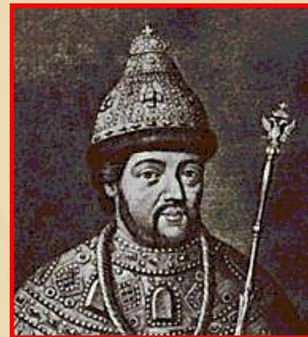
Иван с 1689 по 1696