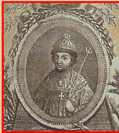
Федор до 1682