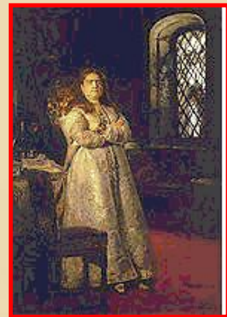
Софья до 1689