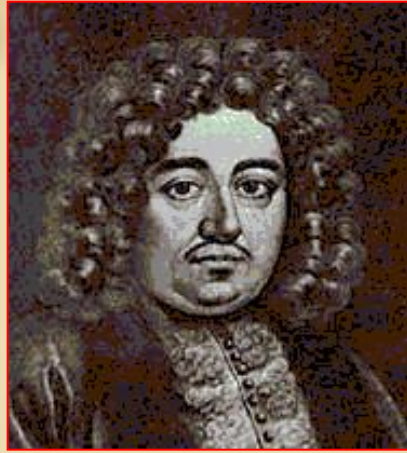
Ф. Лефорт Ф. Головин

Официально посольство возглавляли «великие послы» Ф.Я. Лефорт, Ф.А. Головин, П. Б. Возницын, но реально его деятельностью руководил Петр I Великий, который входил в состав посольства под именем Петра Михайлова. Общее число свиты посольства достигло 250 человек.