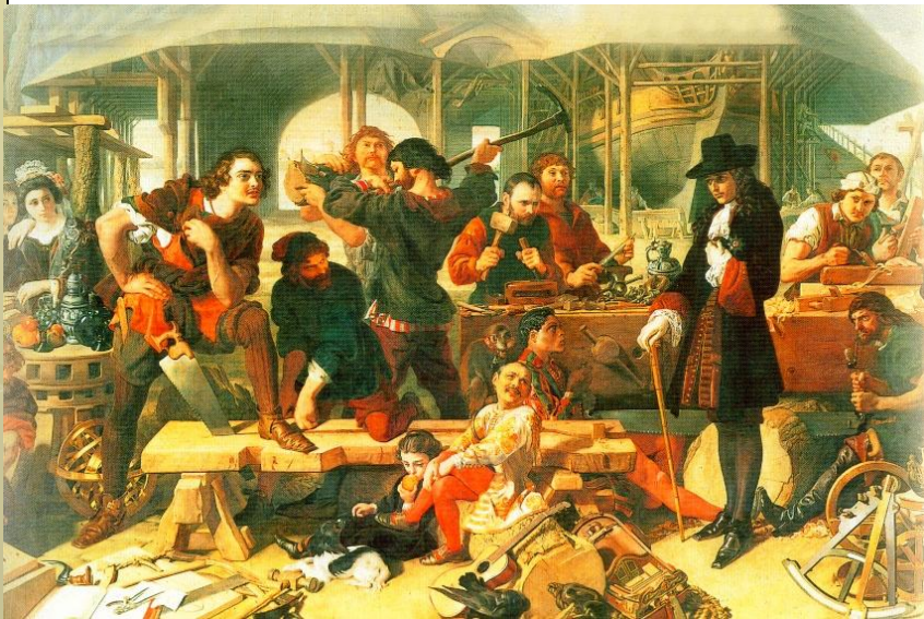
Петр в Голландии

По приглашению Вильгельма Оранского Петр посетил Англию, где научился проектировать корабли. «Великое посольство», находясь в Австрии, выяснило, что союзников для борьбы с турками найти не удастся и Петр поспешил приехать в Вену. Но там он получил известие о бунте стрельцов. .