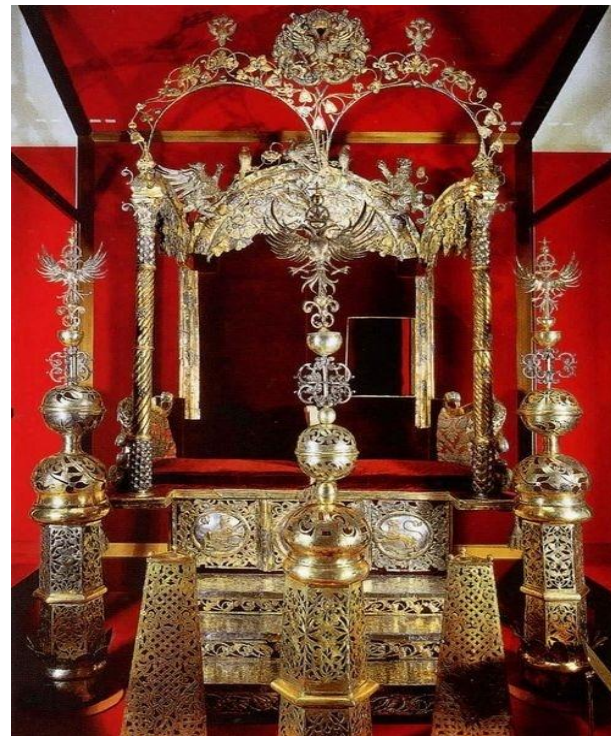
Двойной трон Петра и Ивана

Петр стал посещать Немецкую слободу и подружился с иностранцами.