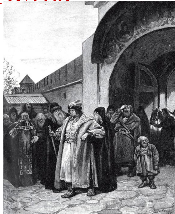
К. Лебедев. Приезд Петра в Троице-Сергиеву обитель 8 августа 1689 года.

Петр в страхе бежал в Троице-Сергиев монастырь . Вскоре туда стали переезжать бояре и Софья поняла, что проиграла. По приказу Петра ее заточили в Новодевичий монастырь. А стрельцов казнили.