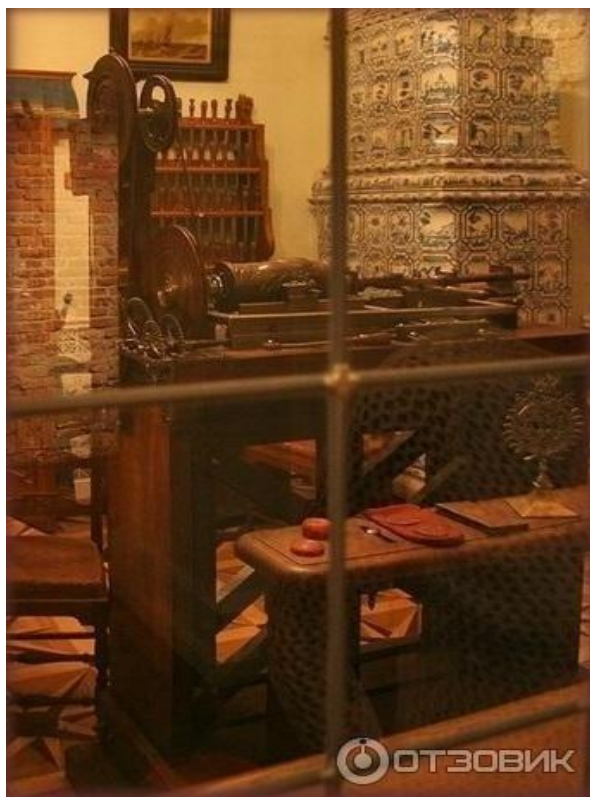
Токарный станок Петра в Зимнем дворце

Наставником у маленького Петра стал Никита Зотов. Он научил мальчика читать, писать и считать и на всю жизнь привил ему интерес к учению.