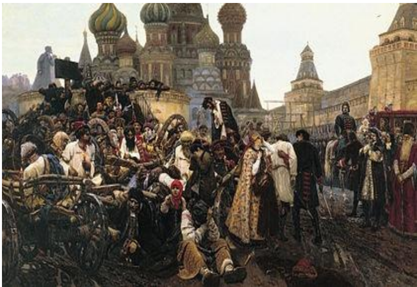
В. И. Суриков. Утро стрелецкой казни

Приехав в Москву, Петр не смотря на казнь 58 человек, провел новое расследование и казнил еще более 700 стрельцов.