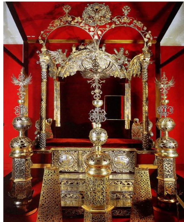
Двойной трон Петра и Ивана

Петр стал посещать Немецкую слободу и подружился с иностранцами.