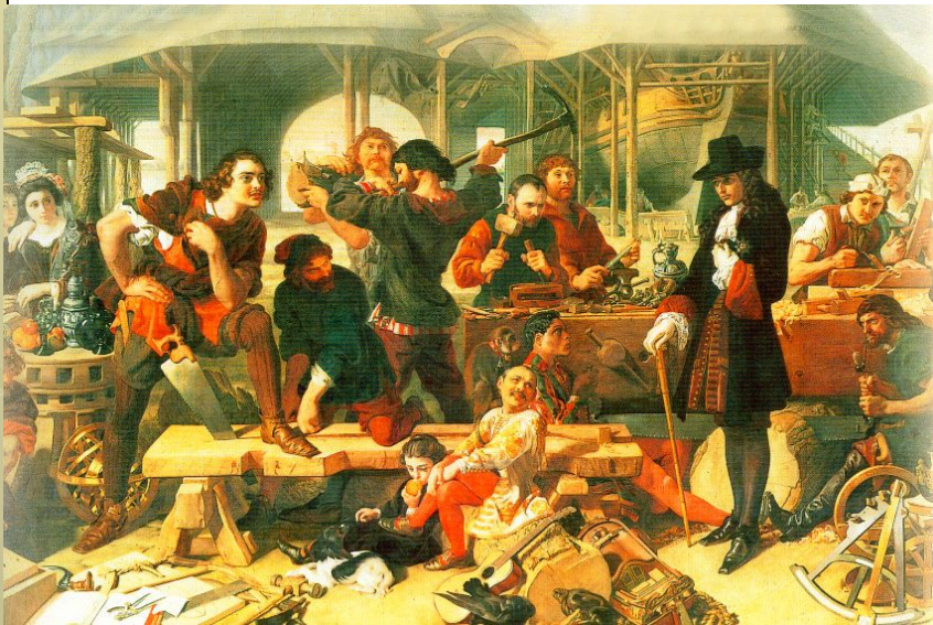
Петр в Голландии

По приглашению Вильгельма Оранского Петр посетил Англию, где научился проектировать корабли. «Великое посольство», находясь в Австрии, выяснило, что союзников для борьбы с турками найти не удастся и Петр поспешил приехать в Вену. Но там он получил известие о бунте стрельцов. .