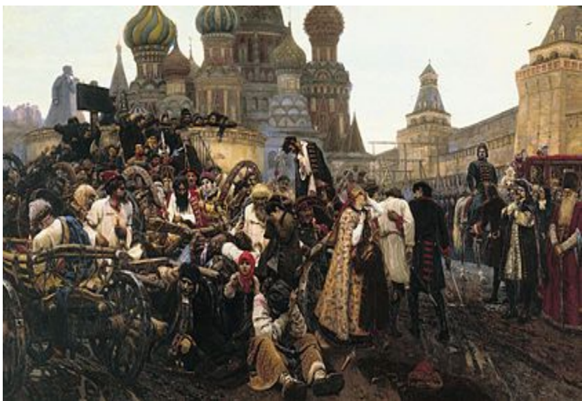
В. И. Суриков. Утро стрелецкой казни

Приехав в Москву, Петр не смотря на казнь 58 человек, провел новое расследование и казнил еще более 700 стрельцов.