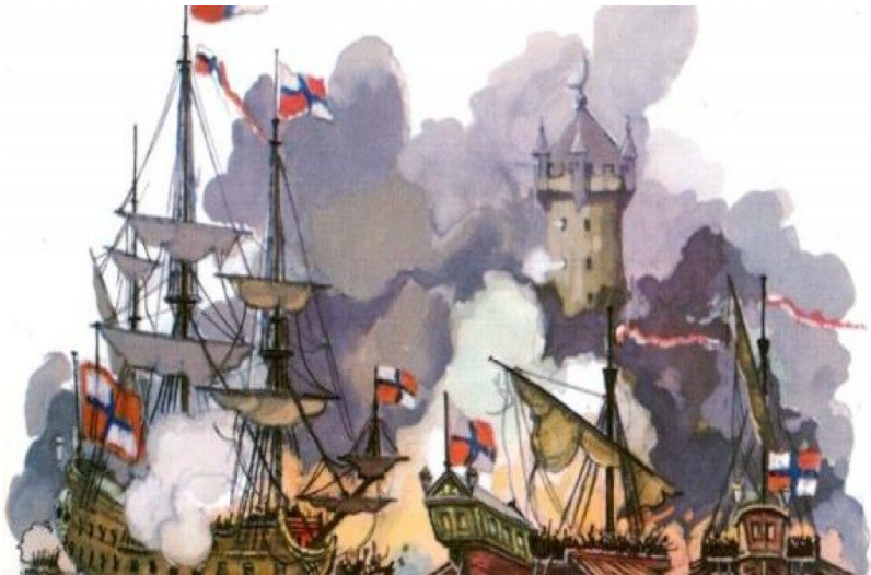
Взятие русскими войсками и флотом Азова в 1696г.

Весной 1696 г. русская армия в сопровождении флотилии спустилась по Дону и вновь осадила Азов. На этот раз город был блокирован и с суши и с моря. Вскоре начался штурм и Азов пал. Но, не владея проливами, торговать с Европой по-прежнему было нельзя.