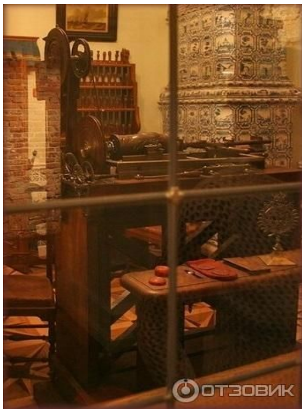
Токарный станок Петра в Зимнем дворце

Наставником у маленького Петра стал Никита Зотов. Он научил мальчика читать, писать и считать и на всю жизнь привил ему интерес к учению.