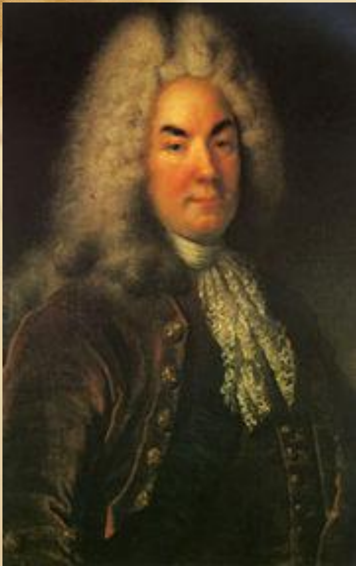
Петр Андреевич Толстой