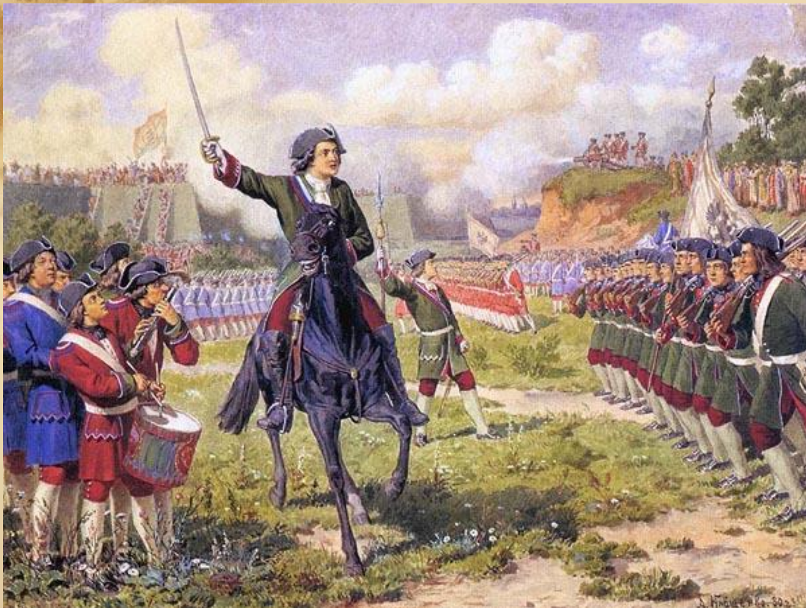
Игры потешных войск Петра I возле села Преображенское