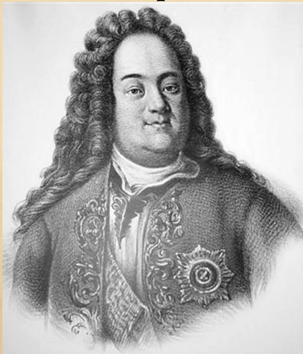
Федор Алексеевич Головин