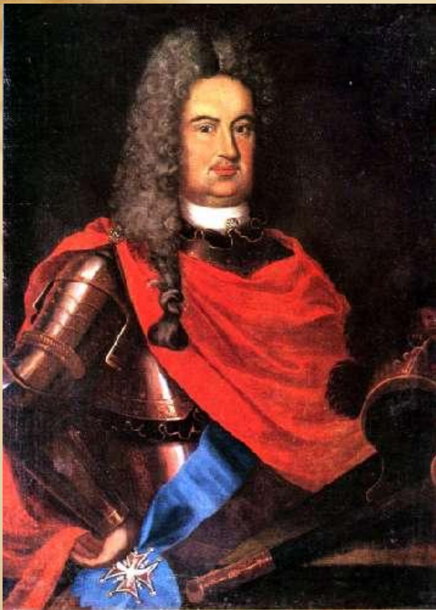
Борис Петрович Шереметев