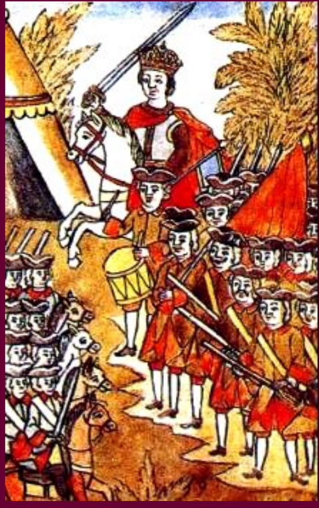
Петр и потешные полки