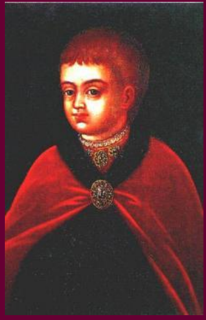
Петр I в детстве.