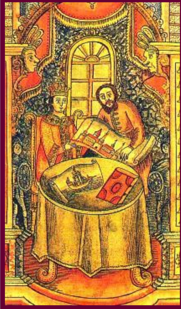
Петр и Н.Зотов. Миниатюра к. 17 в.

У маленького Петра наставником стал Н.Зотов. Он научил мальчика читать, писать и считать и на всю жизнь привил ему интерес к учению. Зотов, мастер на все руки обучил царевича работе на токарном станке, и впоследствии тот любил и умел работать руками.