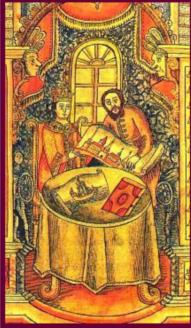
Петр и Н.Зотов. Миниатюра к. 17 в.

У маленького Петра наставником стал Н.Зотов. Он научил мальчика читать, писать и считать и на всю жизнь привил ему интерес к учению. Зотов, мастер на все руки обучил царевича работе на токарном станке, и впоследствии тот любил и умел работать руками.