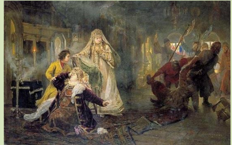
Стрелецкий бунт 1682 г. Стрельцы выволакивают из дворца Ивана Нарышкина

преобразования продолжались, но шли очень медленно; важным внешнеполитическим успехом было заключение мирного договора с Речью Посполитой, закрепившим за Россией Киев