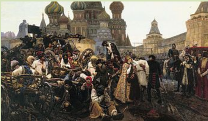
Картина В. И. Сурикова «Утро стрелецкой казни»