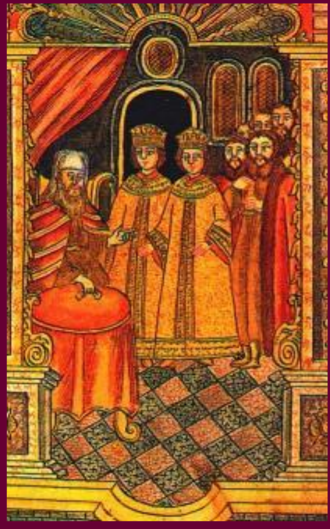
Петр, Иван и патриарх Андриан. Миниатюра к. 17 в.

Во время восстания, стрельцы потребовали сделать царями Петра и Ивана, а Софью регентом.