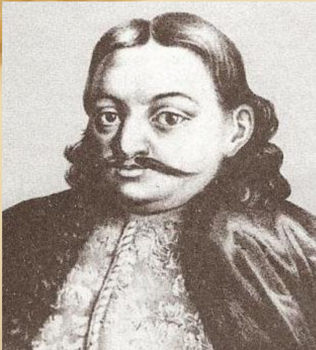
Федор Юрьевич Ромодановский