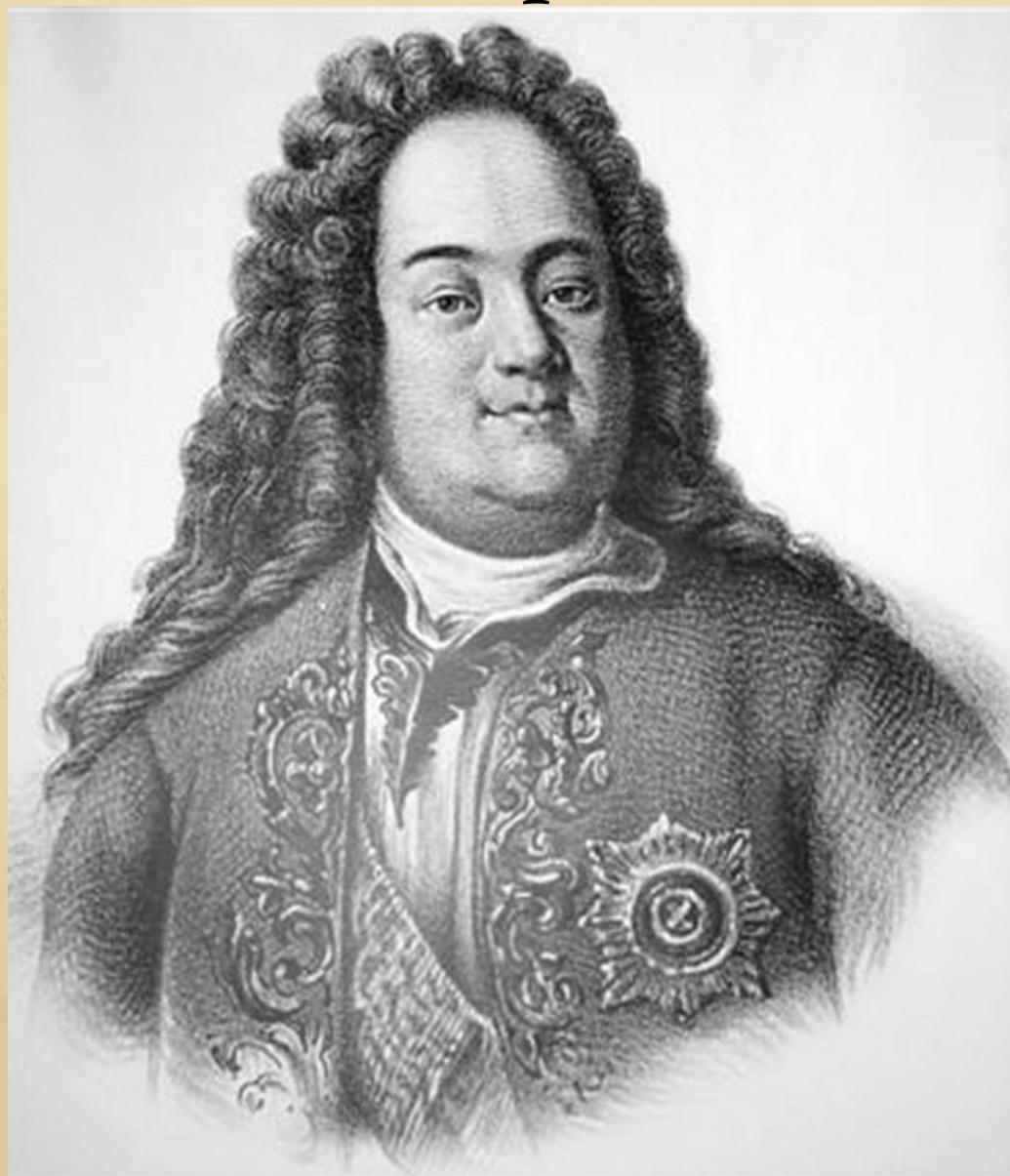
Федор Алексеевич Головин