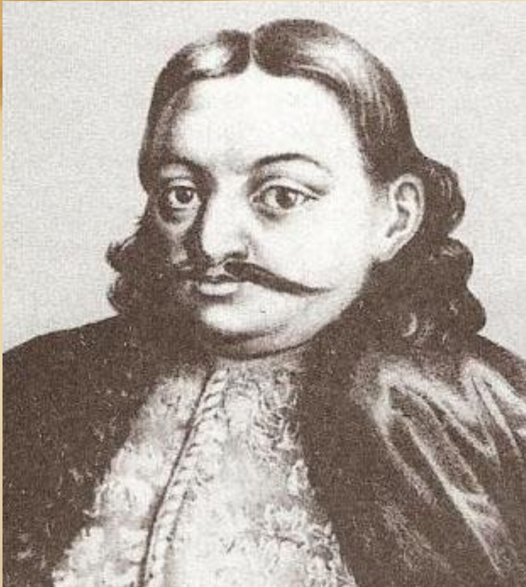
Федор Юрьевич Ромодановский