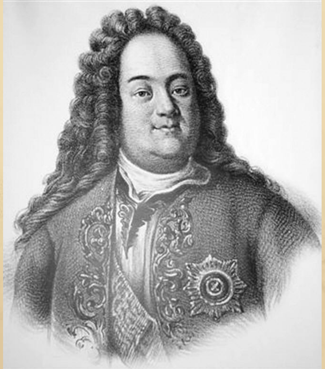
Федор Алексеевич Головин