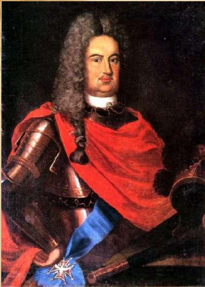
Борис Петрович Шереметев