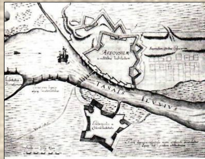
План Азова с прилегающими к нему укреплениями. Гравюра