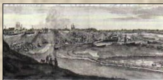
Вид Воронежа и корабельной верфи. Гравюра начала XVIII в.