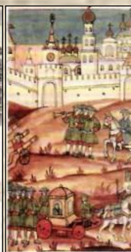
Возвращение Петра I в Москву. Миниатюра первой половины XVIII в.