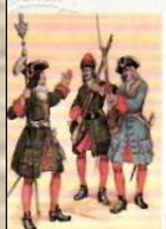
Офицер и grenader лейб-гвардии Преображенского полка, фузилер лейб-гвардии Семеновского полка. 1700-1720 гг.