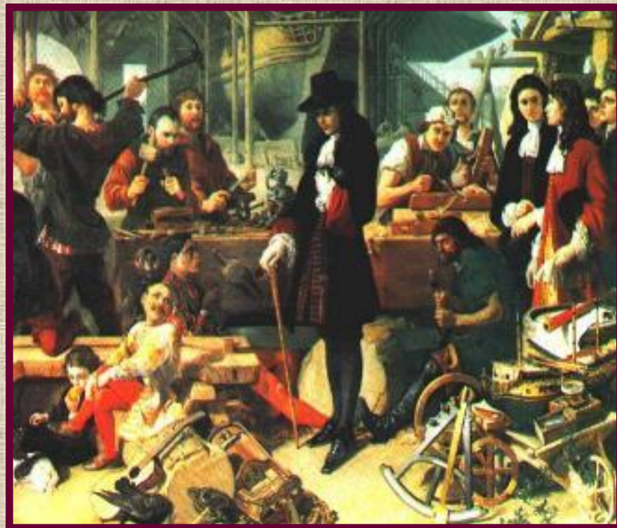
Петр I на верфи в Англии. Современный рисунок.