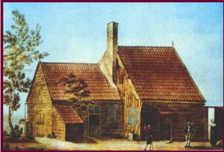
Домик Петра I на Саардамской верфи. Миниатюра конца 17 в.