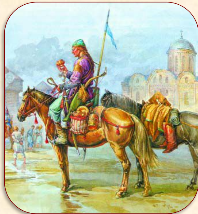
Половцы в захваченном русском городе